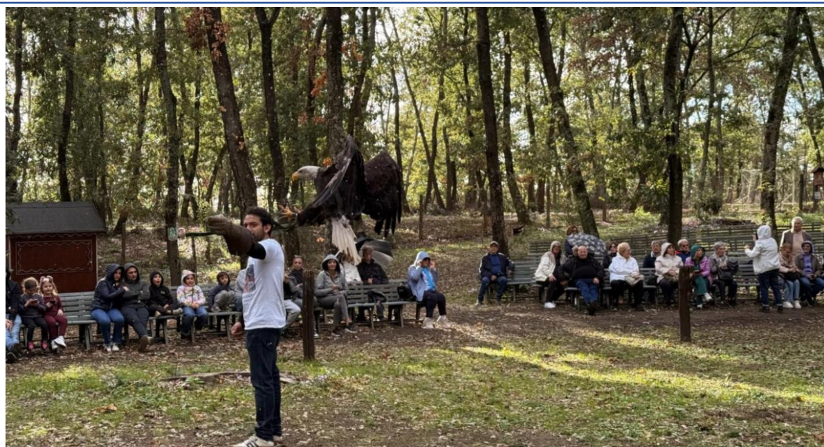
園區老鷹表演活動