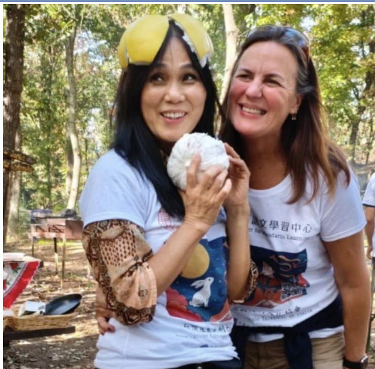
與會者都很喜歡柚子帽