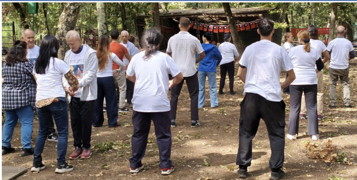
太極老師指導動作