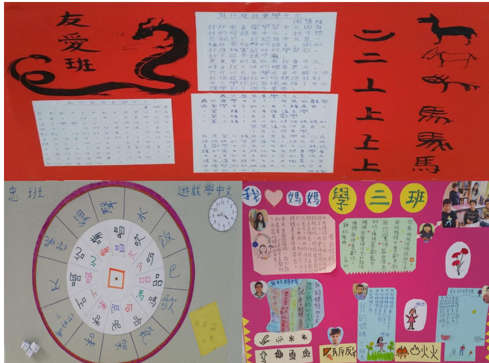
壁報比賽一，二，三名