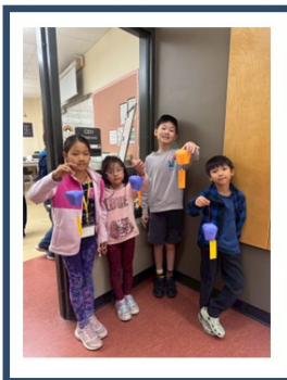
各班學生作品展示與合影