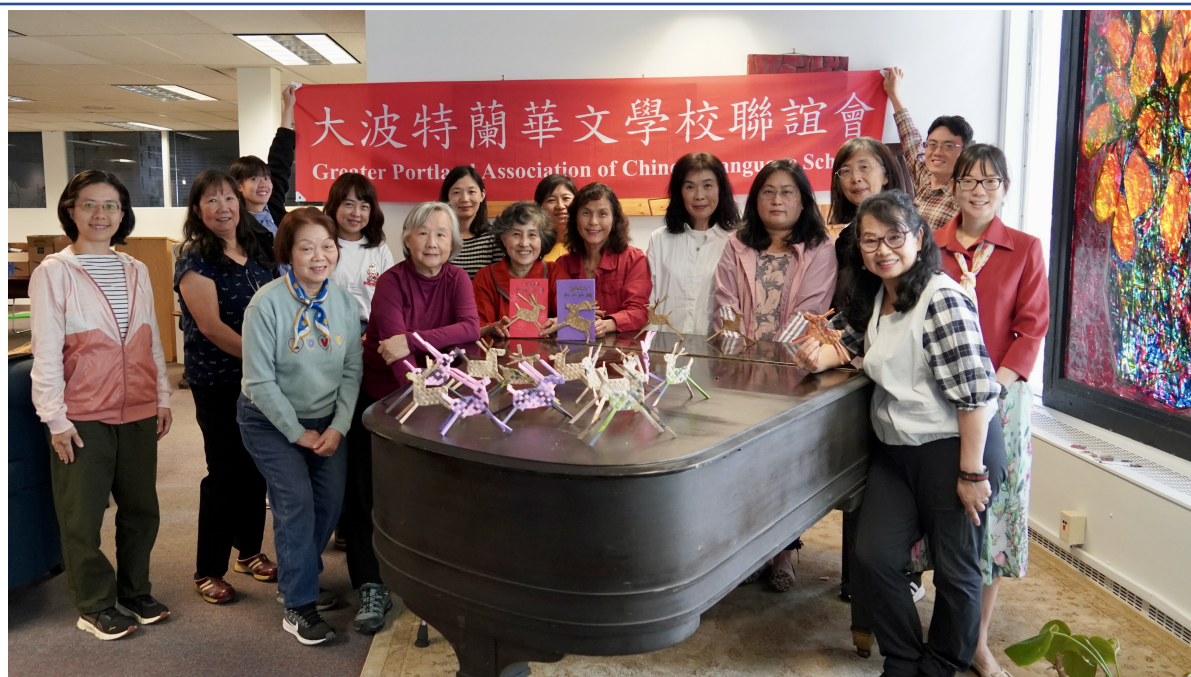
共同參與創意手作課程