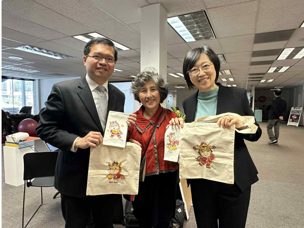
陸璋老師特別致贈手繪「一馬當先」帆布袋