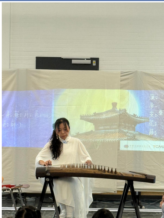
古箏演奏〈荷塘月色〉