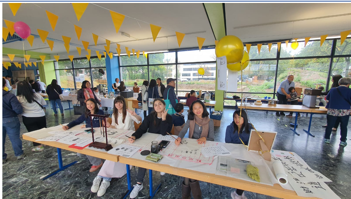
學生親自體驗揮毫寫字