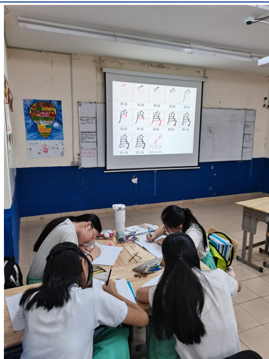
中學組 上推廣正體字課