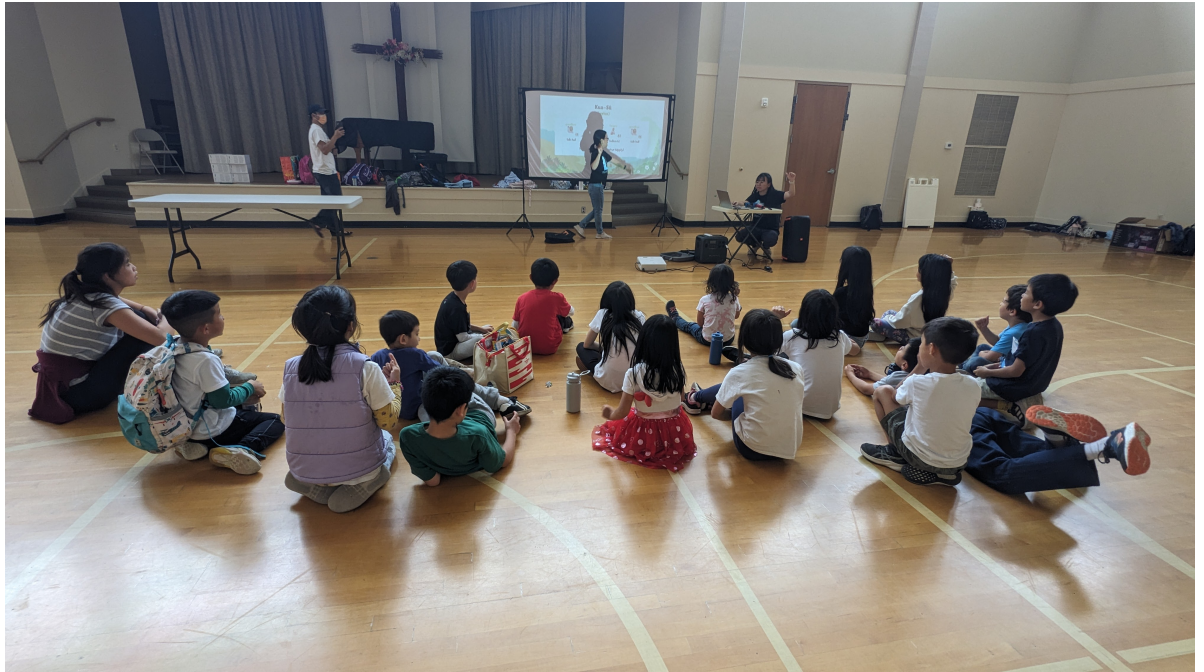
囡仔認真學習台語囡仔歌