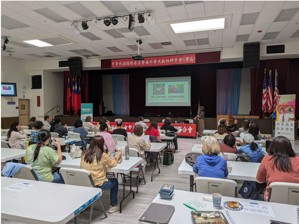
7/18，7/19，7/20，三天實體課程現場一