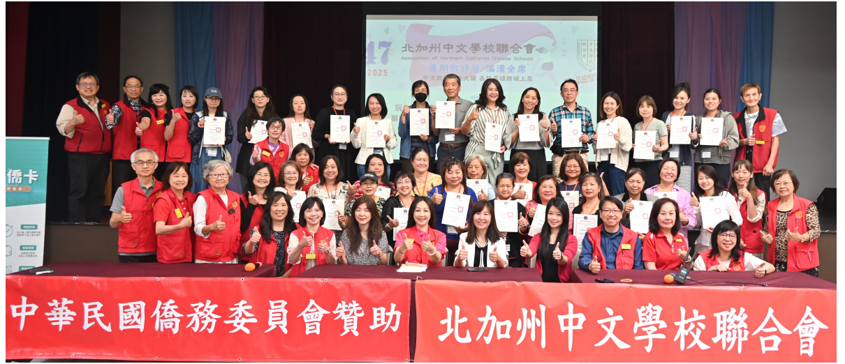
七月二十日 「北加州中文學校聯合會」暑期教師營結業式大合照