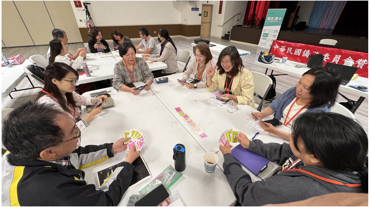
7/18, 7/19, 7/20, 三天實體課程現場二