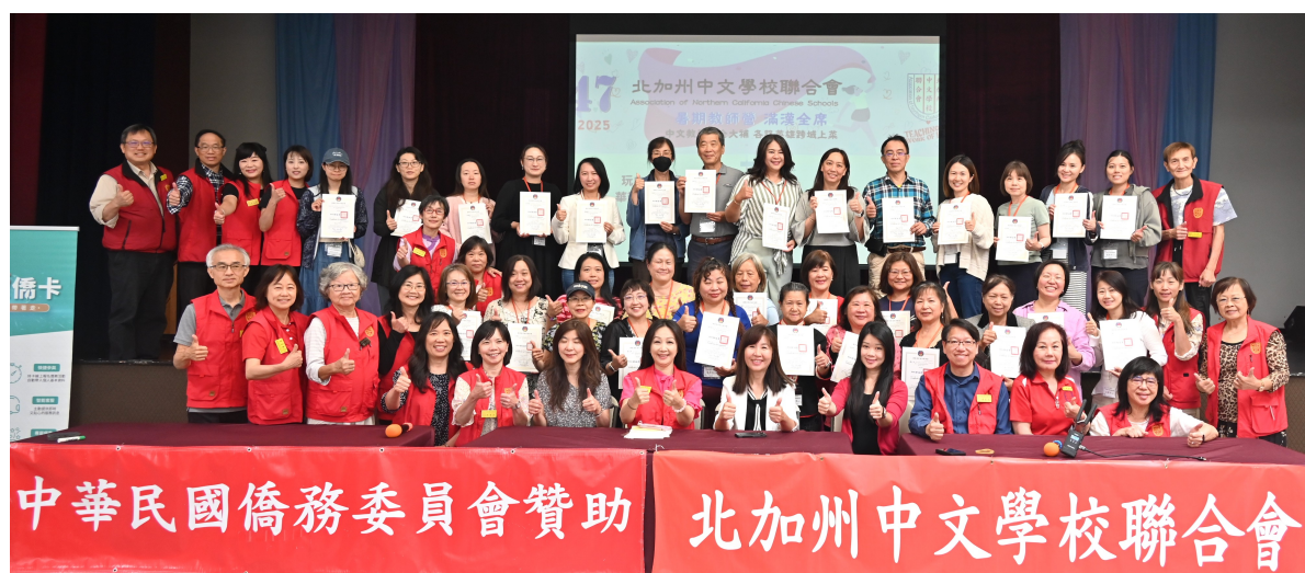
七月二十日 「北加州中文學校聯合會」暑期教師營結業式大合照