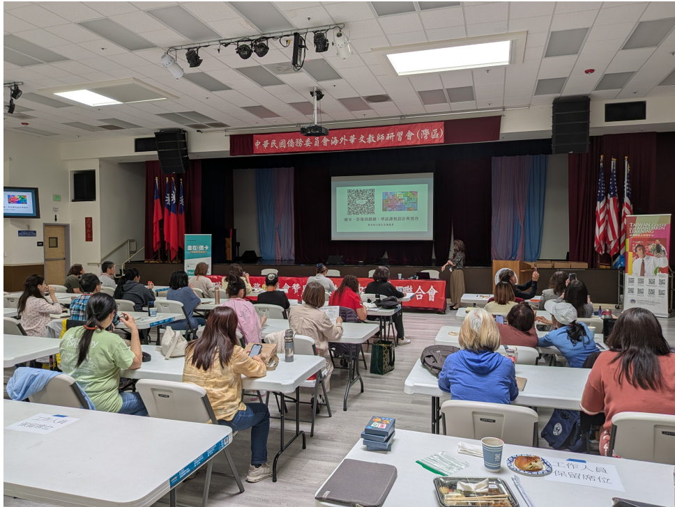
7/18, 7/19, 7/20, 三天實體課程現場一