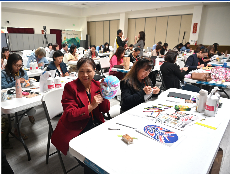
7/18，7/19，7/20，三天實體課程現場三