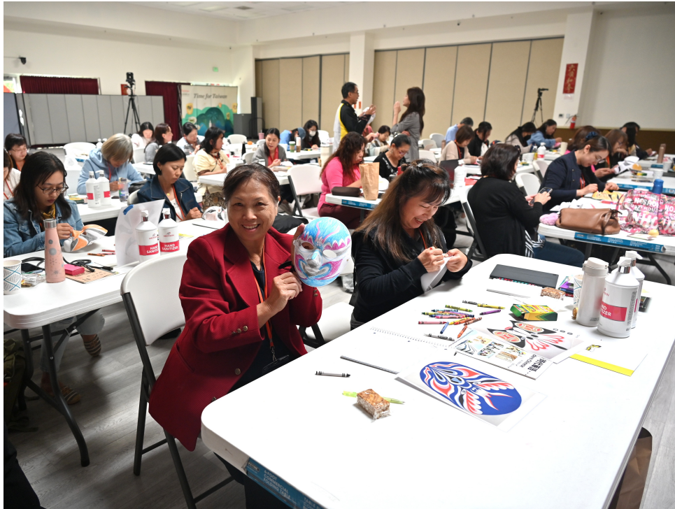
7/18, 7/19, 7/20, 三天實體課程現場三