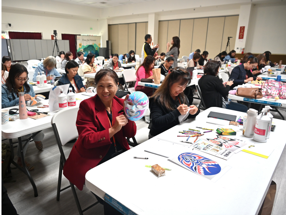
7/18, 7/19, 7/20, 三天實體課程現場三