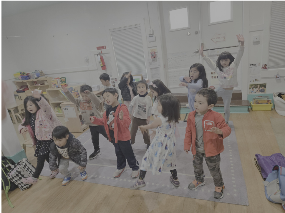
幼兒園班小朋友在中文課堂上學習唱歌