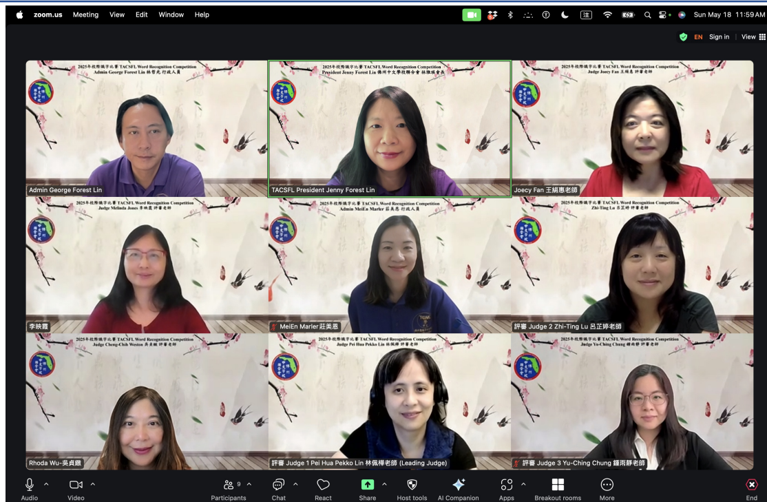
識字比賽的評審老師及行政人員