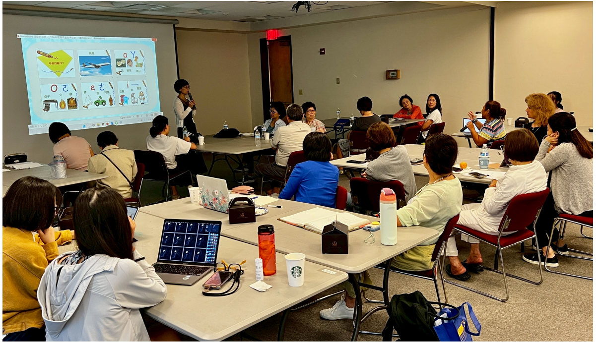
參與學員適時發問交流