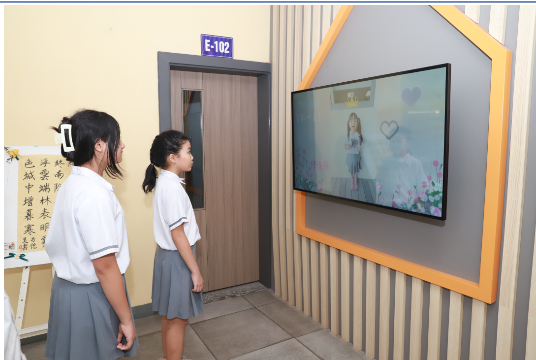
詩歌朗誦比賽得獎作品公布