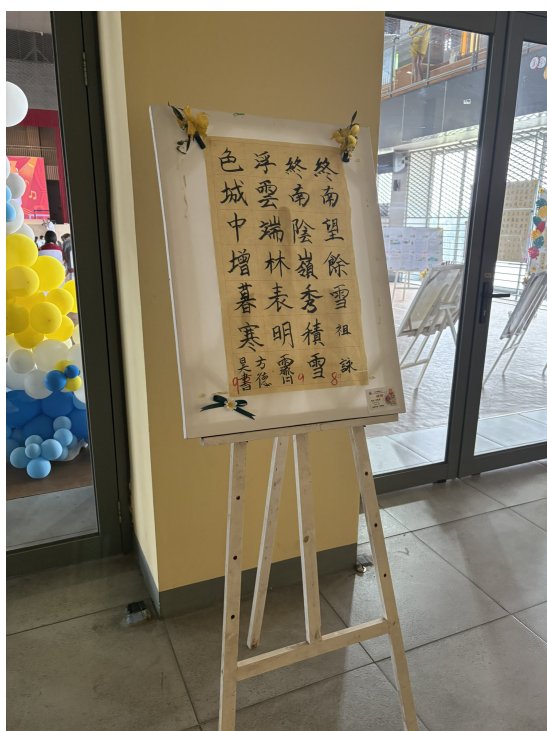
書法比賽第一名作品

越華國際學校將持續以雙語教育為根本，深化學生的語文思維與國際競爭力，培養具備人文底蘊與世界視野的未來公民。