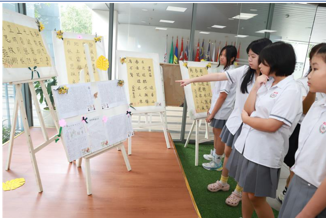
得獎作品展覽會場