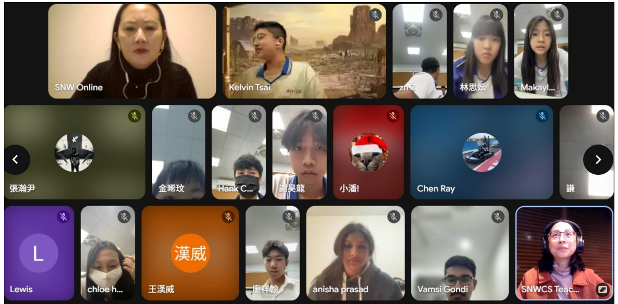
澳洲西北中文學校與台灣光仁中學學生透過 Google Meet 線上交流，彼此分享網路詐騙經驗，氣氛熱絡。