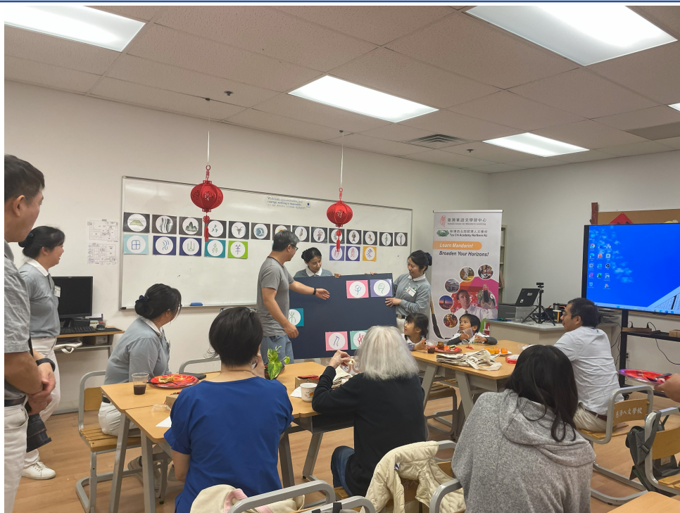
學員們參與「圖畫、甲骨文與現代字體配對」的遊戲