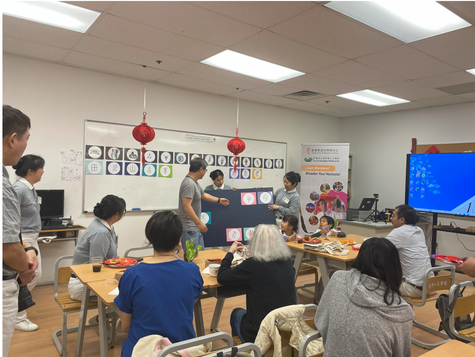
學員們參與「圖畫、甲骨文與現代字體配對」的遊戲