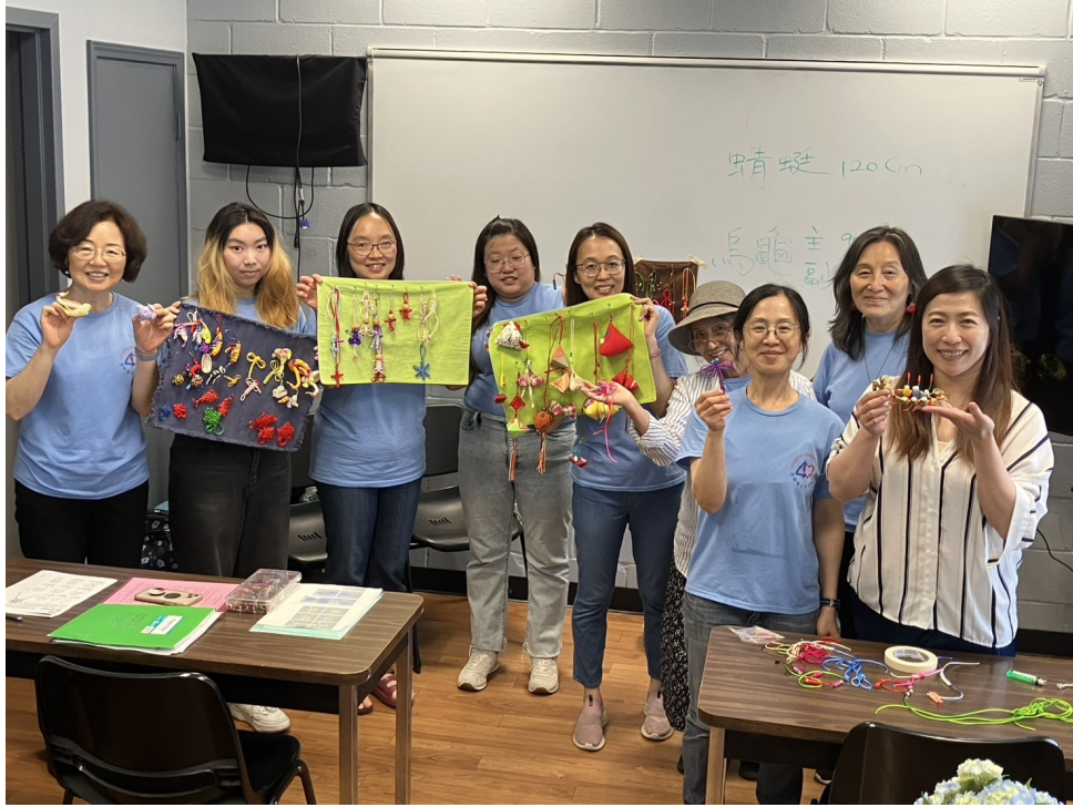
亞特蘭大中文學校繩結文化教學研習3