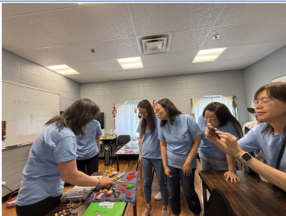
亞特蘭大中文學校總結文化教學研習2