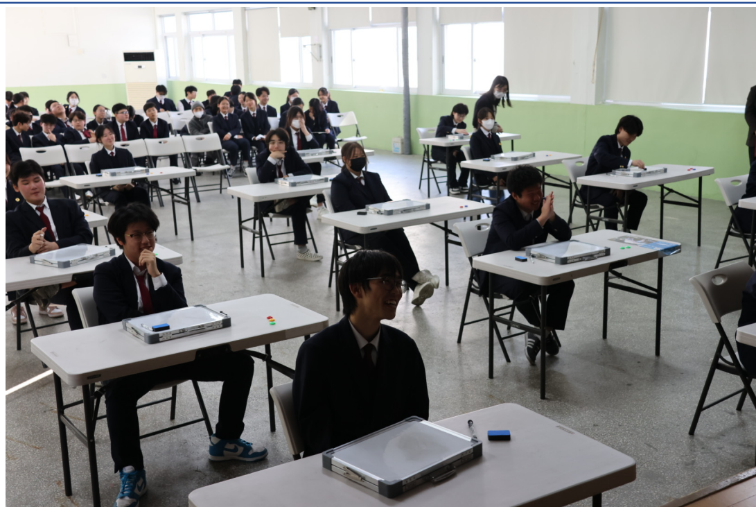
釜中藏字：漢字大師爭霸戰-高中部作答情形