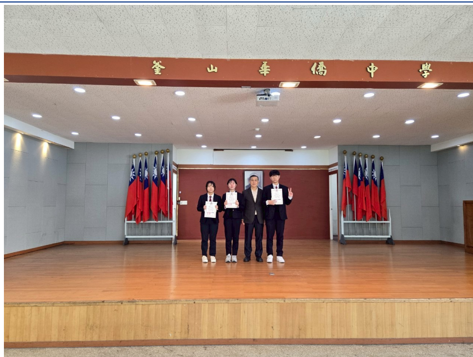
釜中藏字：漢字大師爭霸戰-高中部頒獎