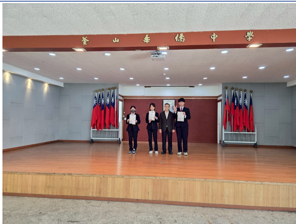
釜中藏字：漢字大師爭霸戰-初中部頒獎