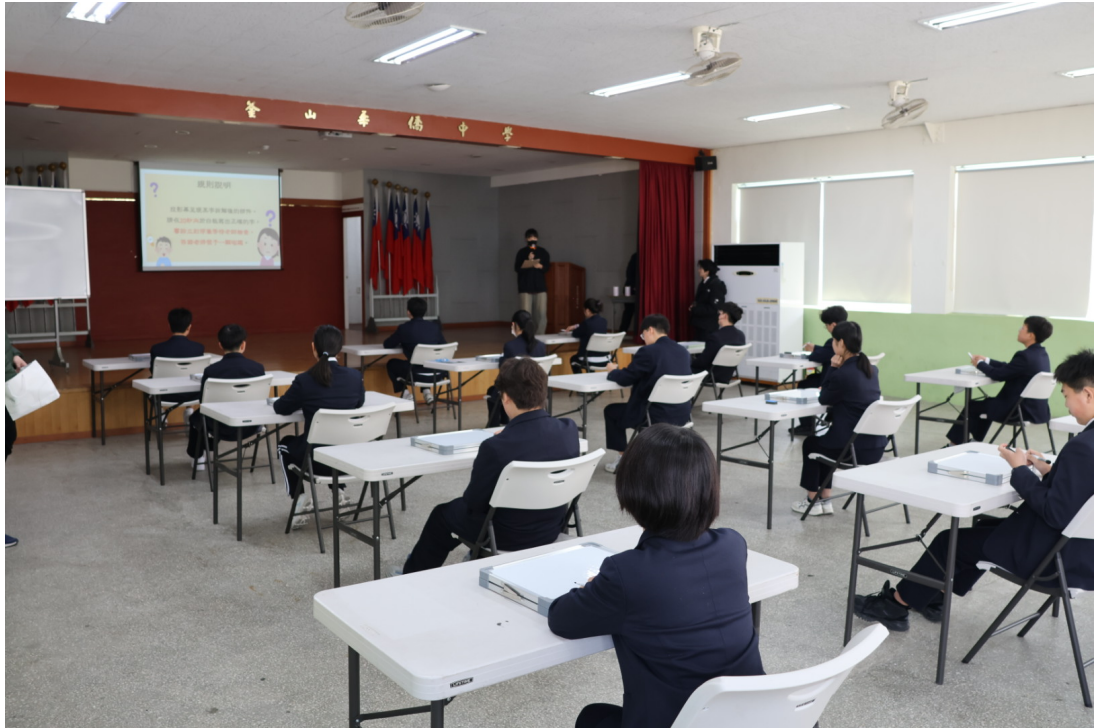
釜中藏字：漢字大師爭霸戰-比賽規則說明