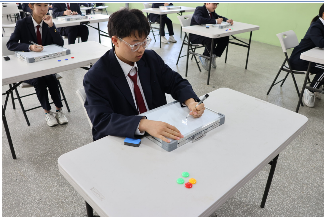
釜中藏字：漢字大師爭霸戰-初中部作答情形