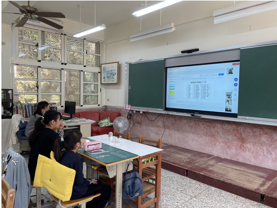
嘉義仁和國小英語會話