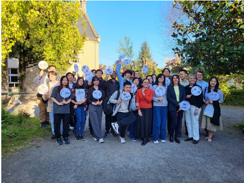
同學們和和他們的正副校長及貴賓們拿著完成的扇子，趁著美好春天在校園內合影