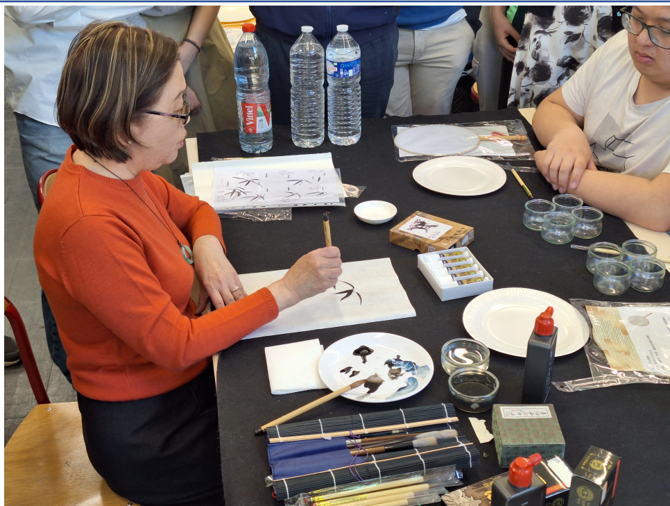
示範下掩的竹葉、筆法