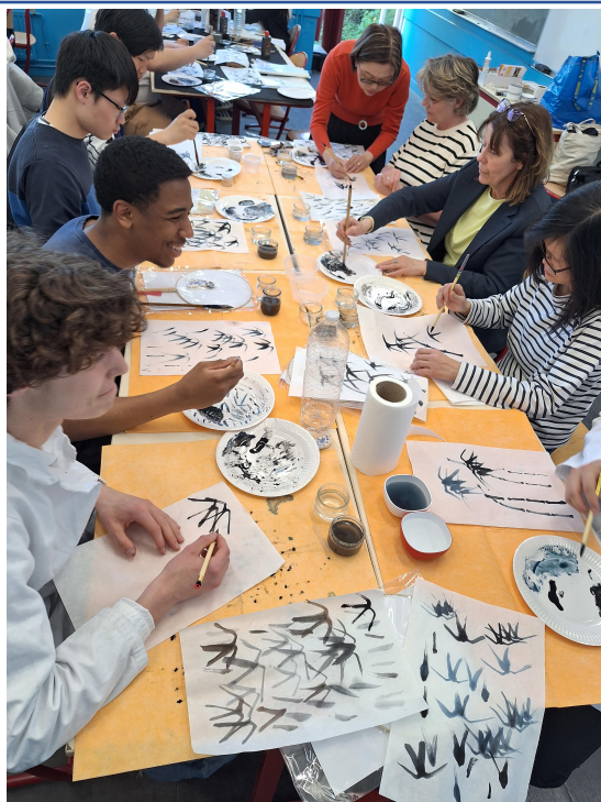
學生們專注在練習竹葉的畫法