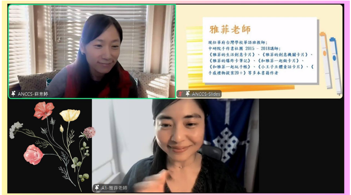
來自華府的雅菲講師 「AI 助攻！用 ChatGPT + PPT 打造創意華語教材」