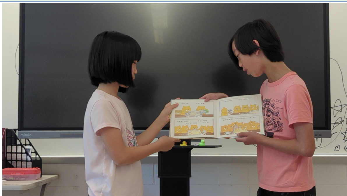
華府台灣學校 華語文才藝競賽回顧5