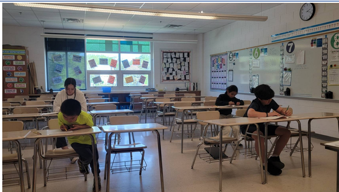
華府台灣學校 華語文才藝競賽回顧2