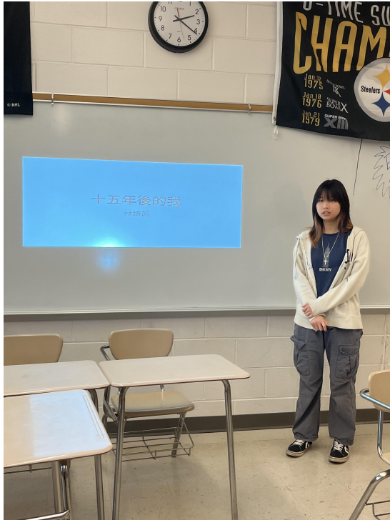
華府台灣學校 華語文才藝競賽回顧6