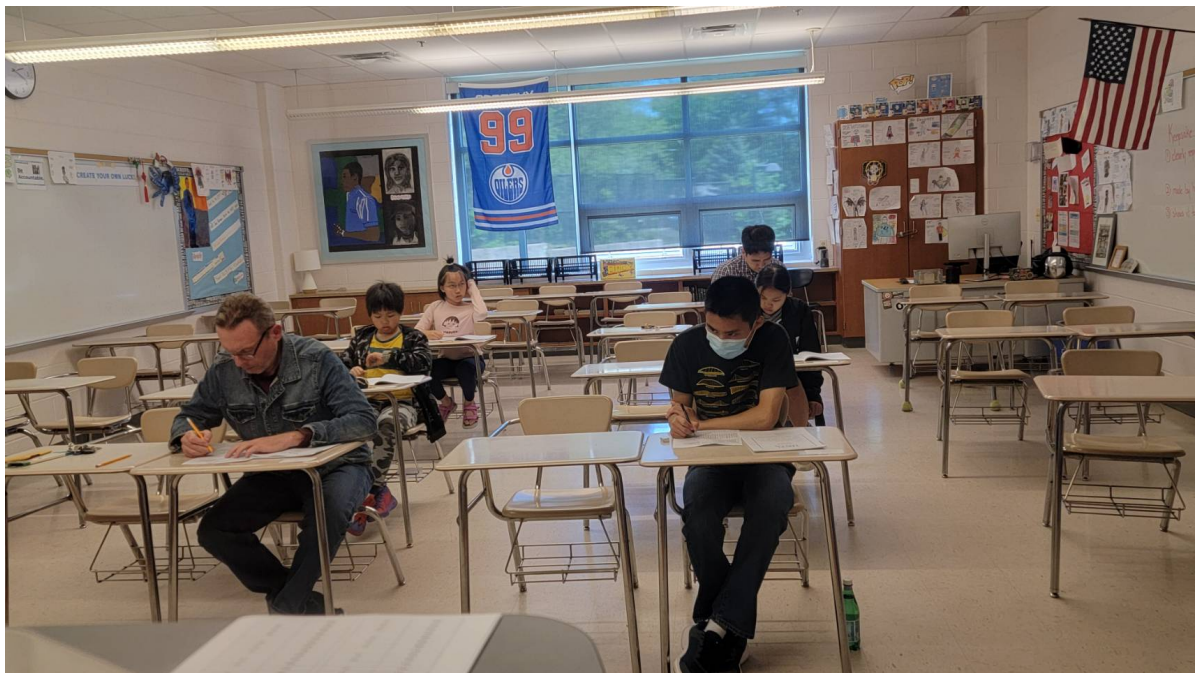
華府台灣學校 華語文才藝競賽回顧1

同一時段，TCML 成人班與部分的學生在華府台灣學校參與了華語文能力測驗（TOCFL）及兒童華語文能力測驗（CCCC），在華府台灣學校與WMACS工作團隊的精心規劃下，測驗順利完成。這場才藝表演與測驗不僅讓學生展現學習成果，更促進了對華語與臺灣文化的深度認識，為這學年畫上精彩的句點！