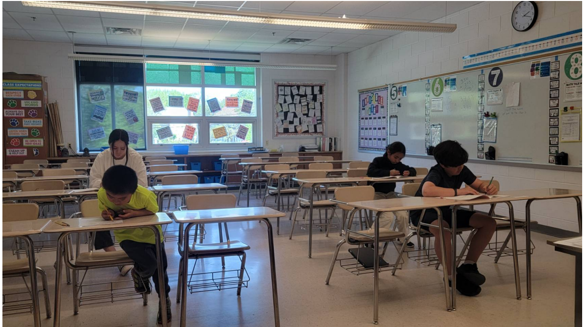
華府台灣學校 華語文才藝競賽回顧2