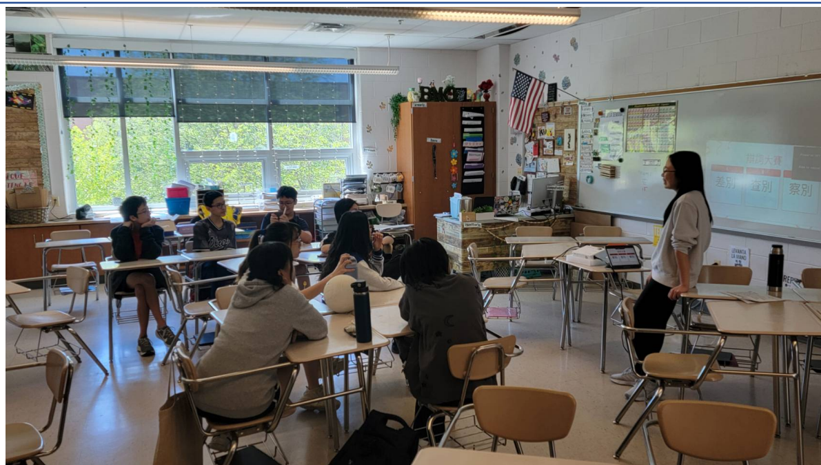
華府台灣學校 華語文才藝競賽回顧3