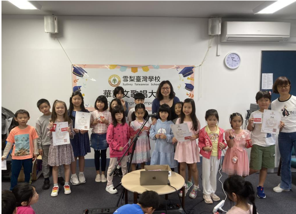
參賽者展現自信，為表演加分