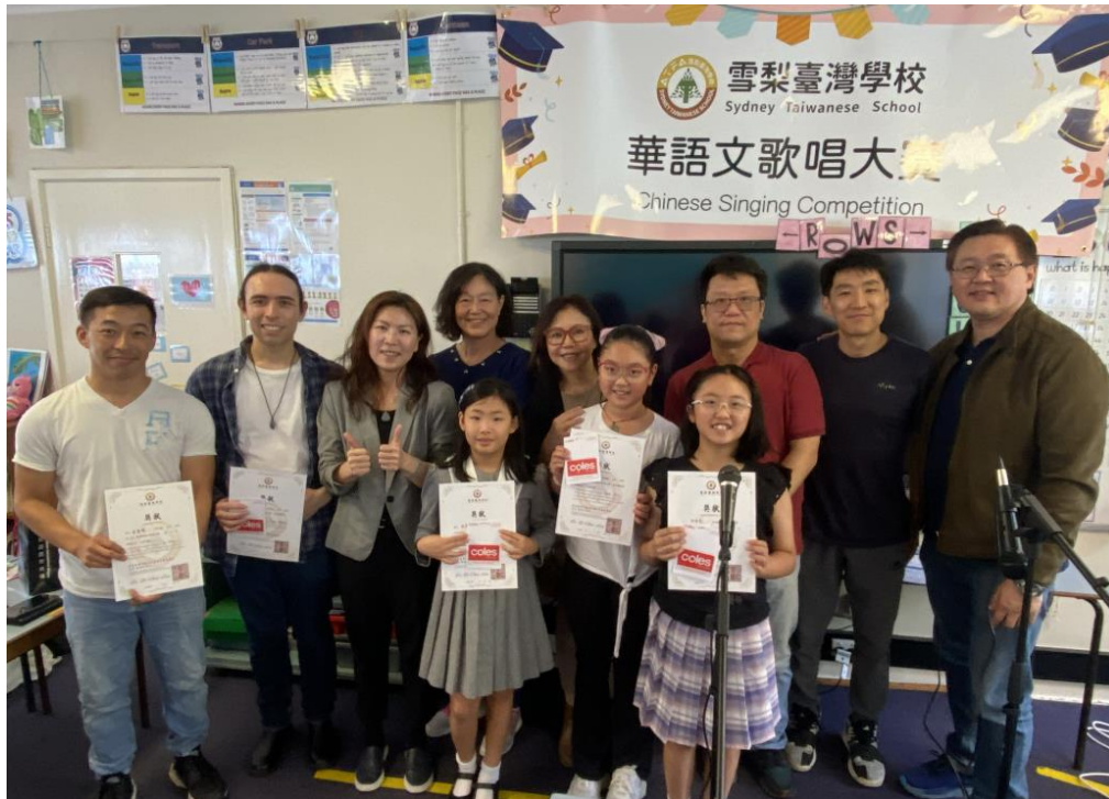
各組參賽者表現亮眼