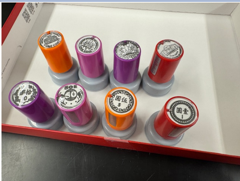
玩遊戲的硬幣印章。