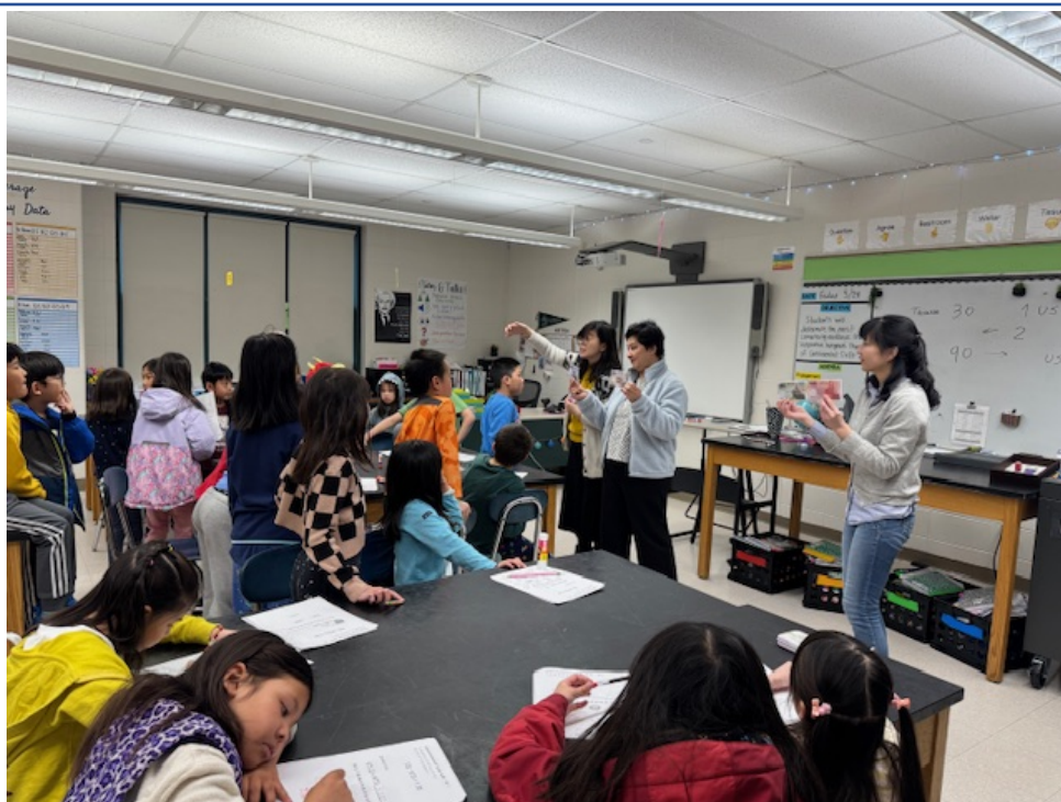
老師拿出臺幣和美金的便條紙讓小朋友看上面的圖案。