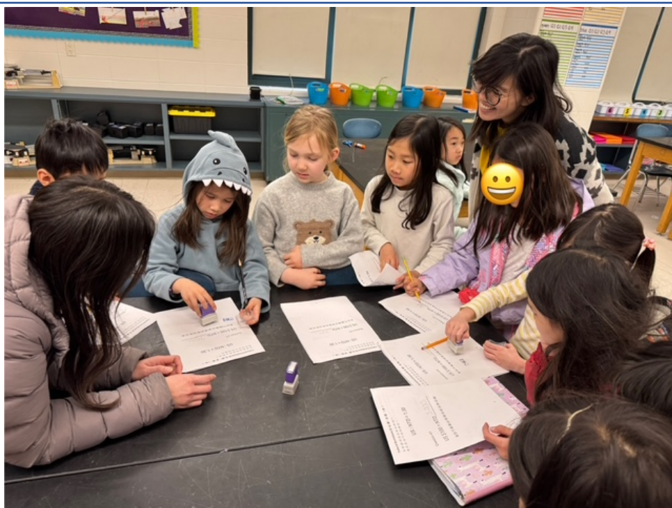
陳老師指導小朋友分組遊戲。