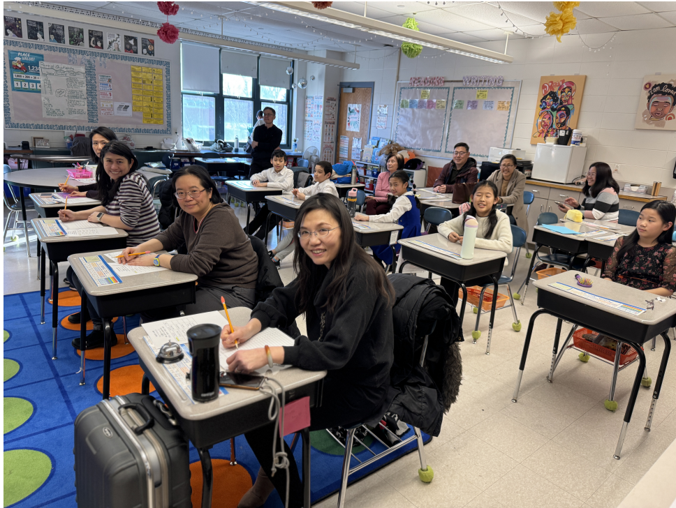
十歲組評審和參賽小朋友合影