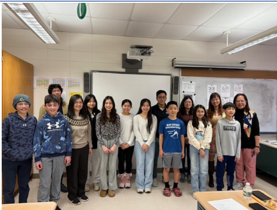
雙語班詩歌朗誦比賽所有參賽同學，和評審老師合影