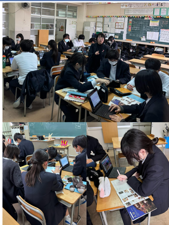
學生們進行分組，討論學到的臺灣文化