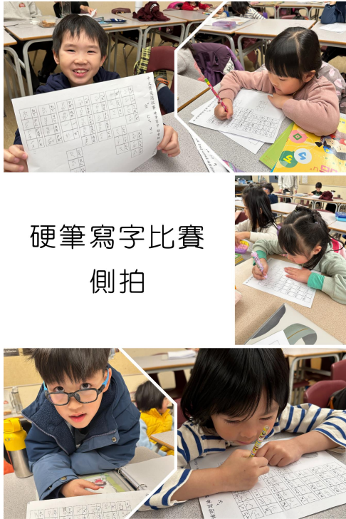
溫哥華菁英中文學校舉辦2025年中文菁英選拔系列賽4