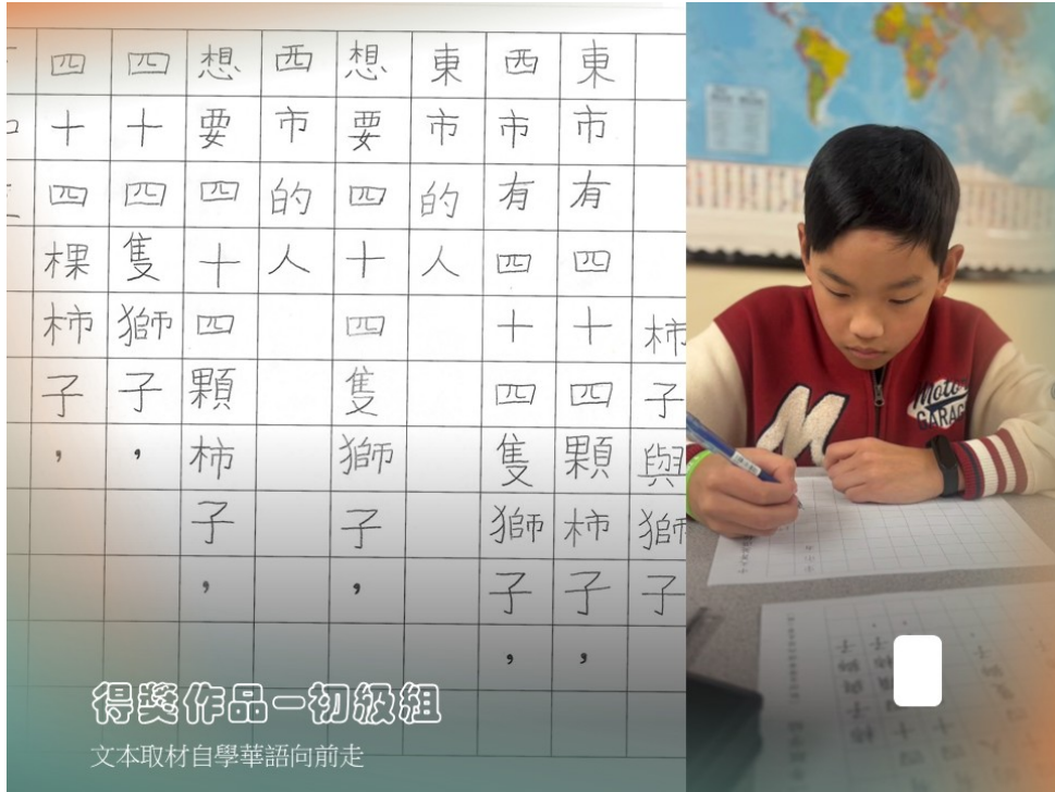
溫哥華菁英中文學校舉辦2025年中文菁英選拔系列賽2