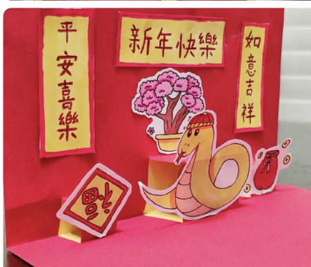
得獎作品集 - 呈現學生的精心構思