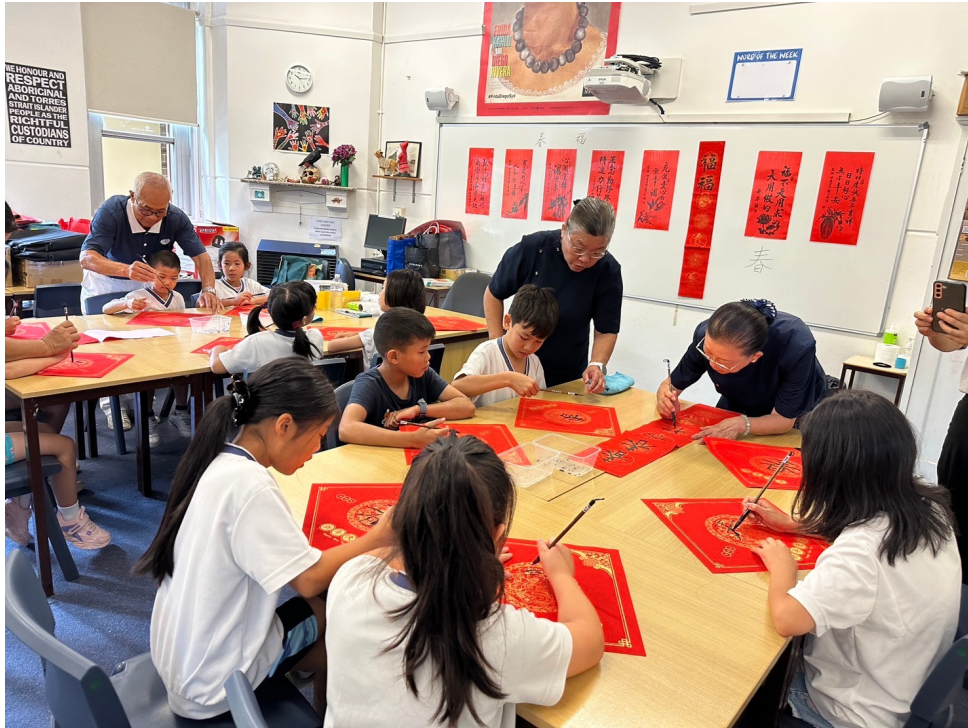
澳洲慈濟人文學校喜迎農曆新年 傳統文化教學活動熱鬧登場5