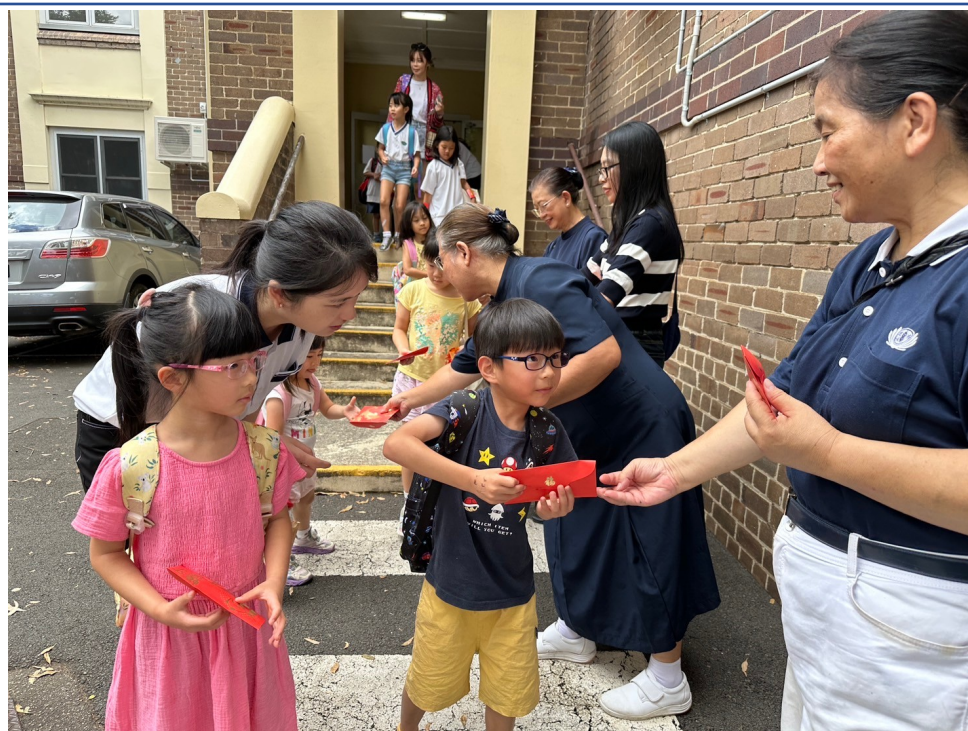
澳洲慈濟人文學校喜迎農曆新年 傳統文化教學活動熱鬧登場3