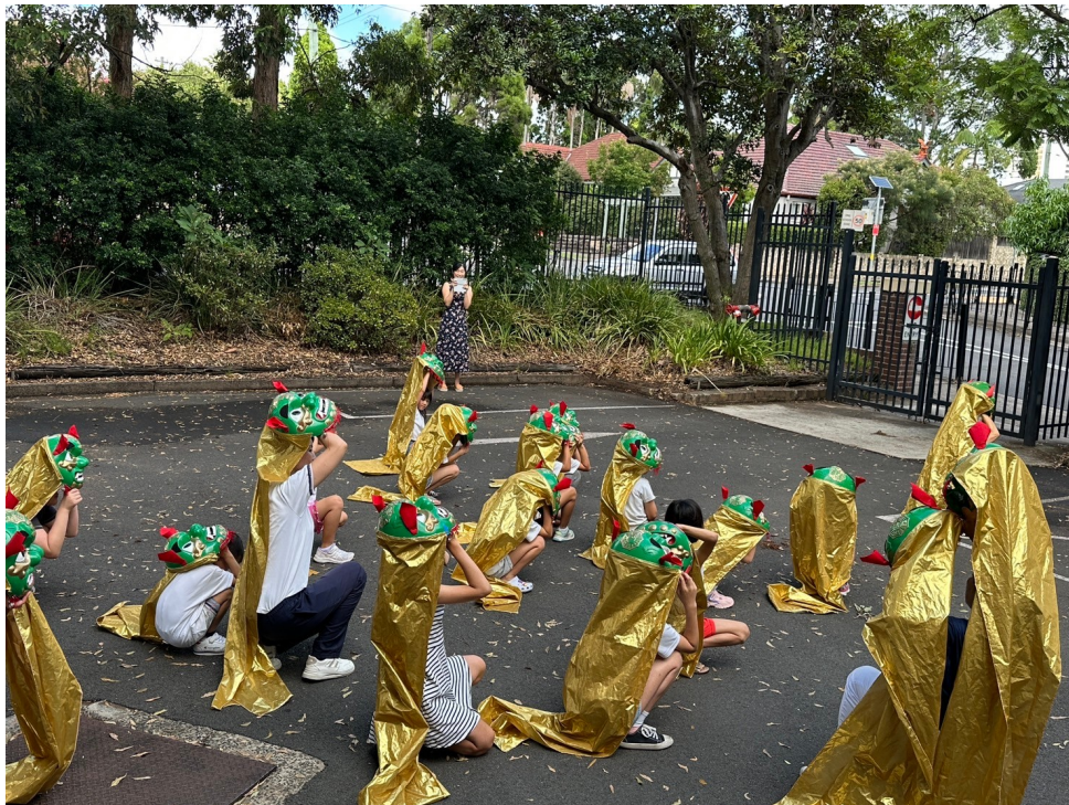
澳洲慈濟人文學校喜迎農曆新年 傳統文化教學活動熱鬧登場1

這場別開生面的農曆新年教學活動，不僅讓學生們學習了豐富的傳統文化知識，更在歡樂的氛圍中感受到農曆新年的美好祝福。澳洲慈濟人文學校透過寓教于樂的方式，讓學生在文化傳承中收穫滿滿，為新的一年揭開美好的序幕！