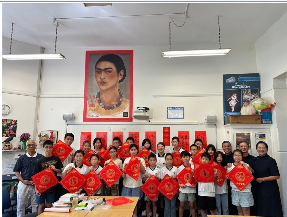
澳洲慈濟人文學校喜迎農曆新年 傳統文化教學活動熱鬧登場2