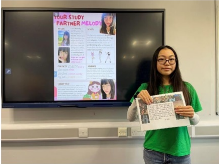
華園2024國際學伴電子海報設計交流活動5