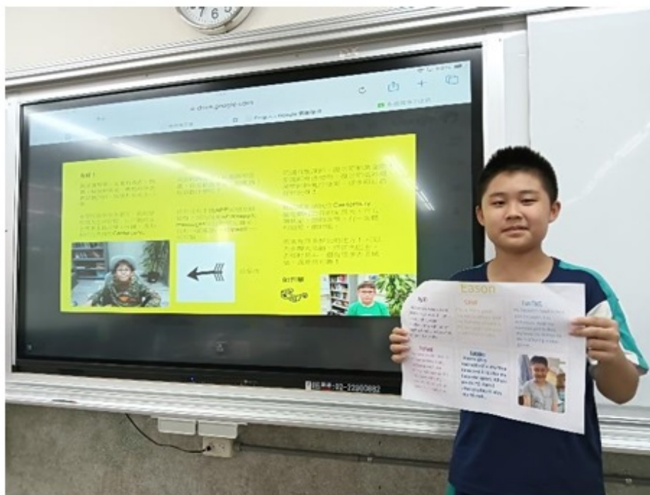
華園2024國際學伴電子海報設計交流活動2