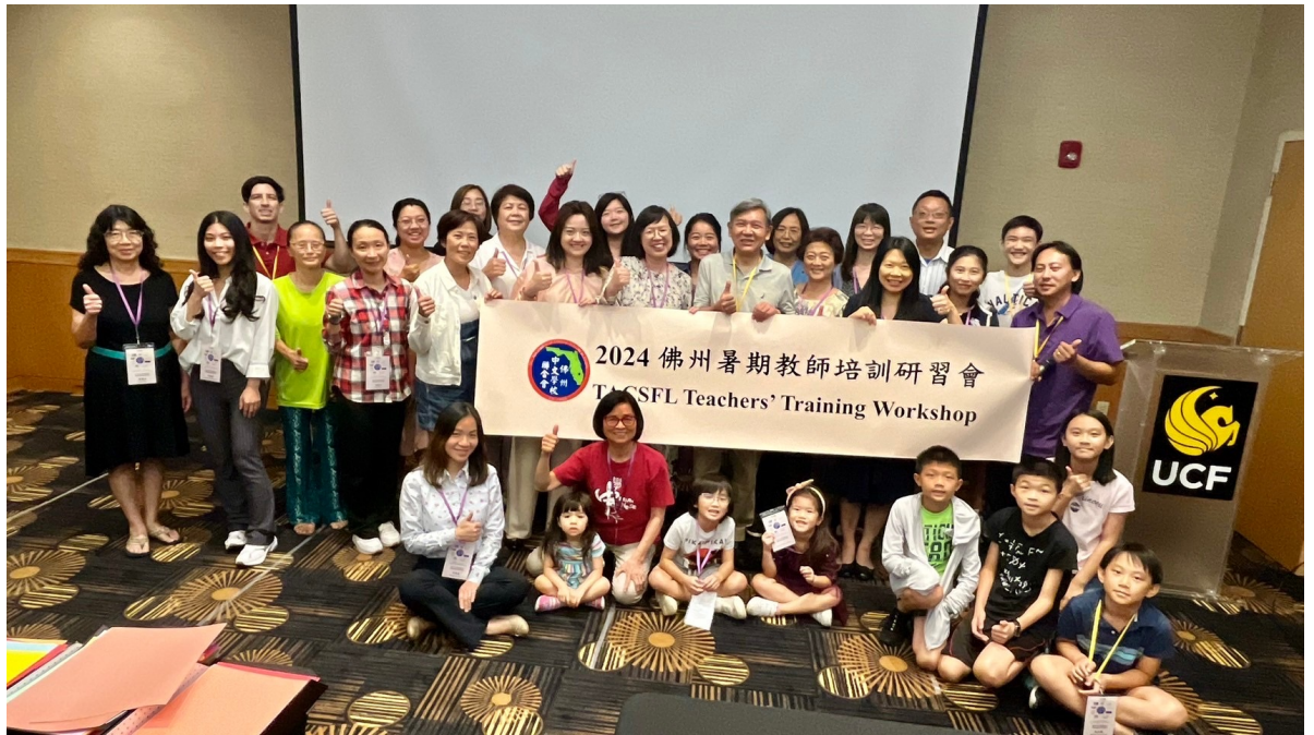
始業式上兩位巡迴講座老師與學員合影