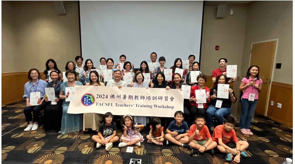
結業式頒發結業證書後合影