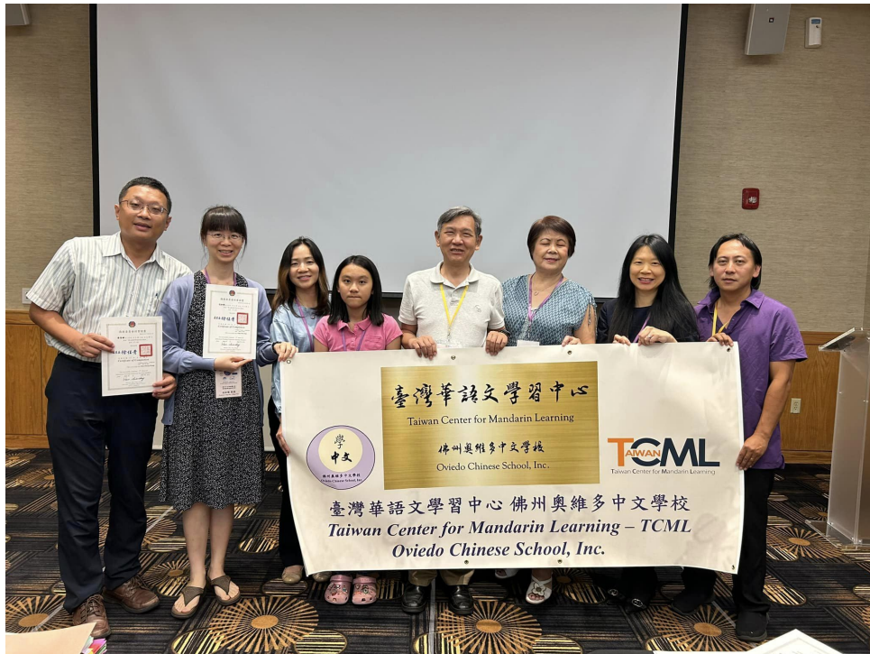
佛州奧維多中文學校老師們參加教師研習會