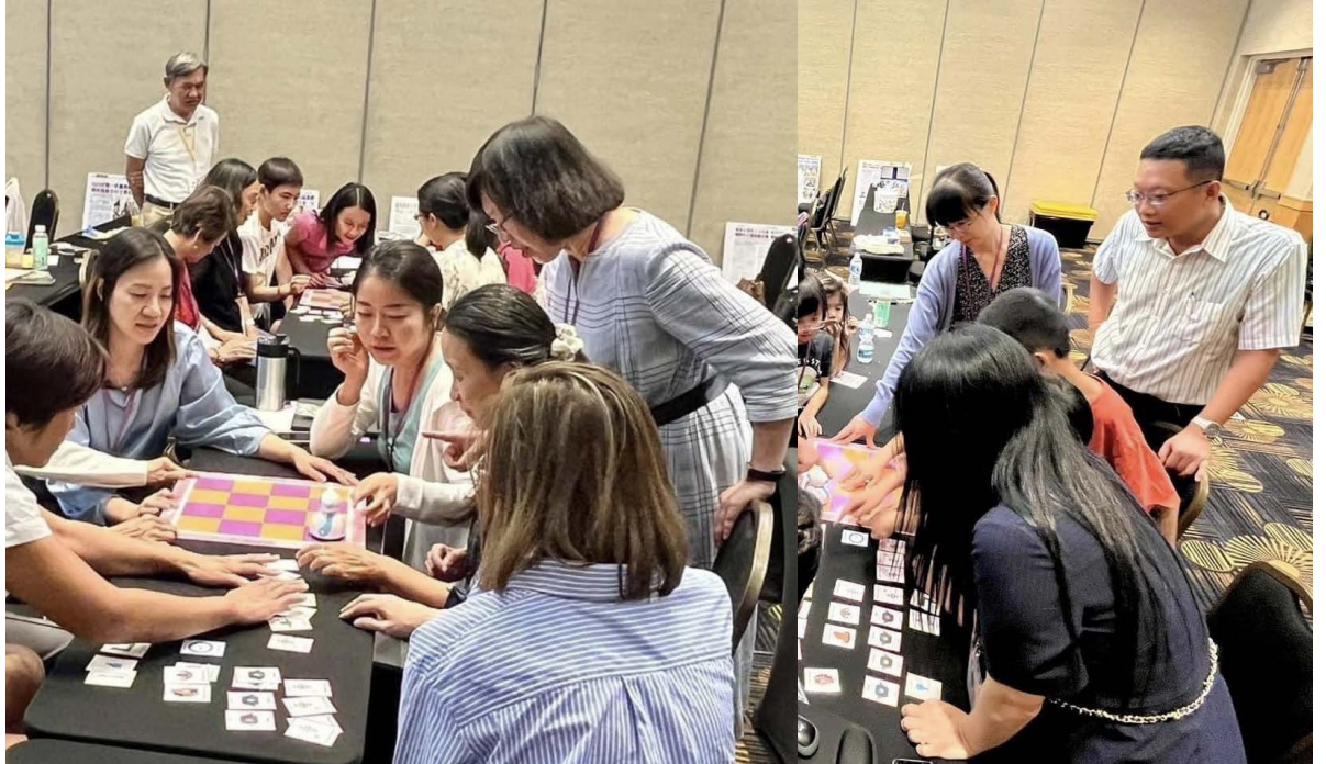
用T. Robot小機器人Coding來教華語文