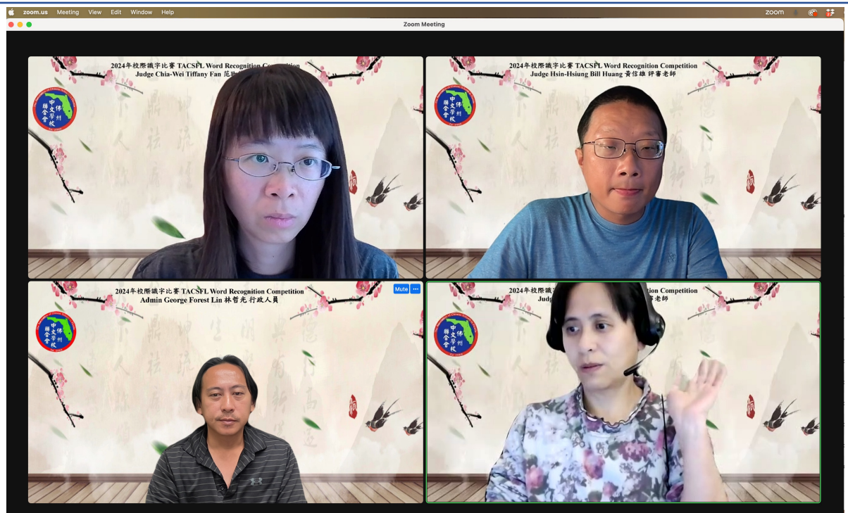
佛州中文學校聯合會識字比賽的評審老師及辛勞的工作人員