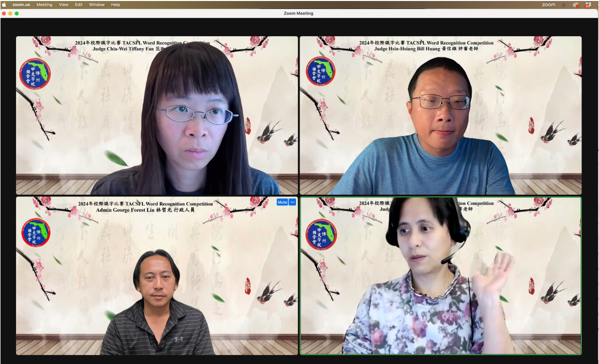
佛州中文學校聯合會識字比賽的評審老師及辛勞的工作人員