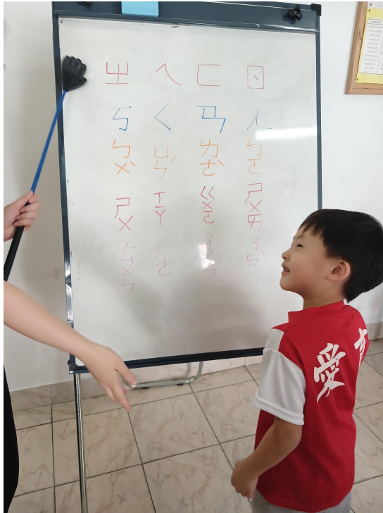
2024學年度愛育學校 正體漢字文化節 「正體漢字文化節幼兒、學前、一年級認字比賽」3