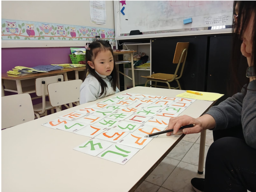
2024學年度愛育學校 正體漢字文化節 「正體漢字文化節幼兒、學前、一年級認字比賽」2