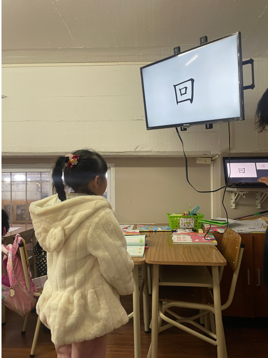
2024學年度愛育學校 正體漢字文化節 「正體漢字文化節幼兒、學前、一年級認字比賽」1