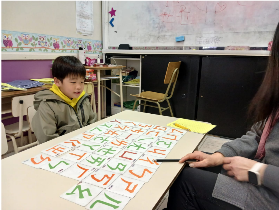
2024學年度愛育學校 正體漢字文化節 「正體漢字文化節幼兒、學前、一年級認字比賽」4