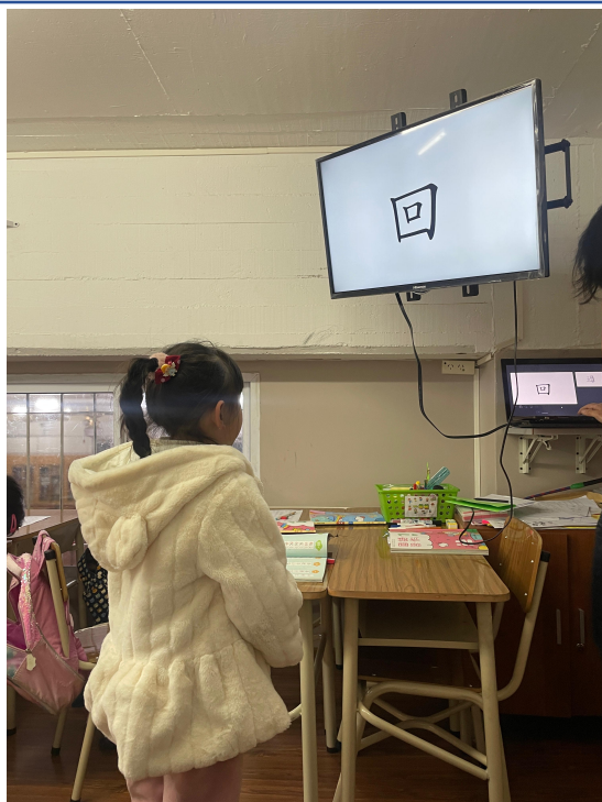
2024學年度愛育學校 正體漢字文化節 「正體漢字文化節幼兒、學前、一年級認字比賽」1