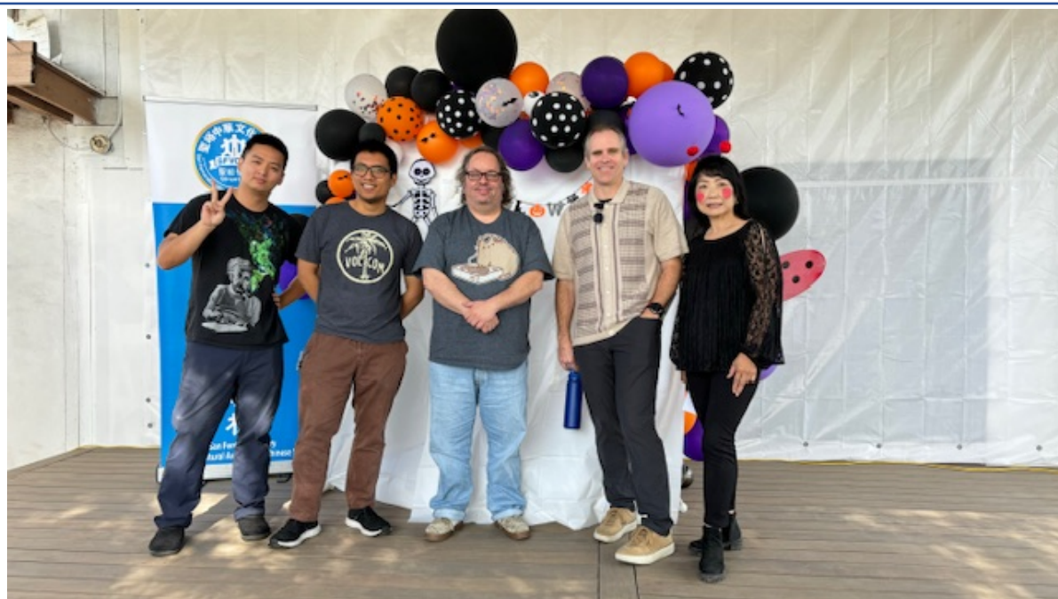
TCML學生私下成了好友-萬聖節活動