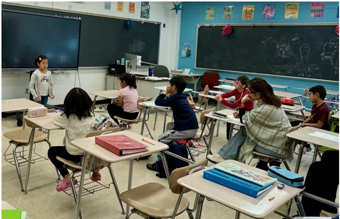
2024年華府中文學校演講比賽1

經過激烈的角逐，各班優勝學生脫穎而出，華府中文學校表示，每學期班際演講比賽不僅是對學生中文能力的檢驗，更是對他們自信心和表達能力的提升。學校也特別感謝所有參與活動的老師和家長的辛勤付出和無私奉獻，為學生們創造一個展示自我和提升能力的平臺，同時也感謝所有參賽學生，積極參與和精彩表現，為此次比賽增添許多亮點。為鼓勵所有學生繼續努力學習中文，積極參與各類文化活動，學校將於近日舉辦頒獎典禮，表揚演講比賽表現優異的學生。