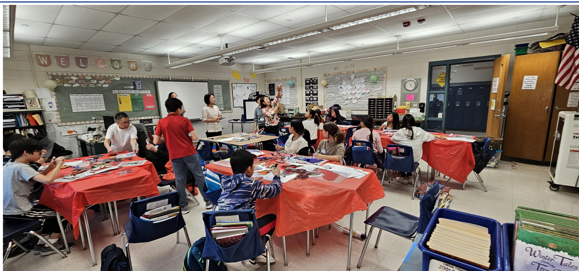
老師說明釘扣放上皮影偶的做法