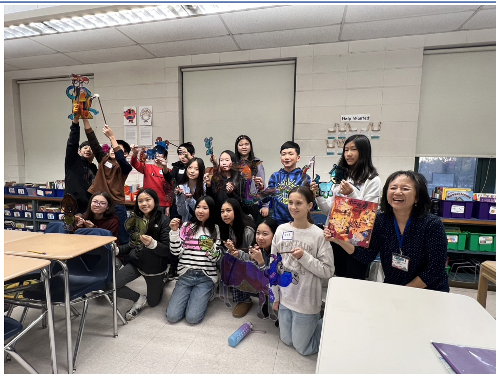
學生們與自己的皮影偶合照