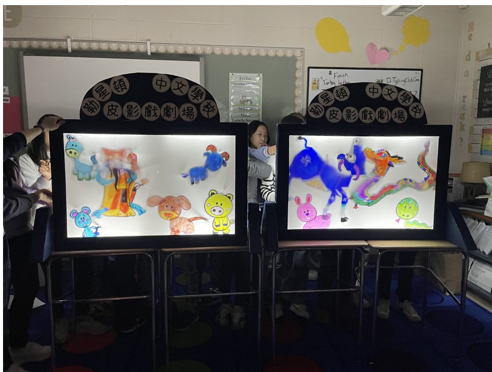
皮影偶的展示效果