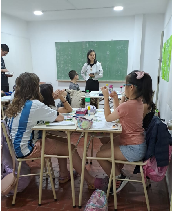
認真聽取比賽規則