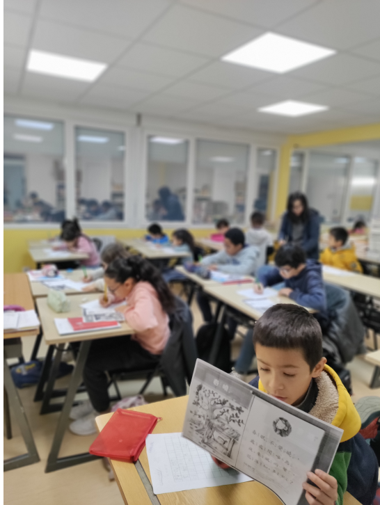
臺灣華語文學習中心-法國亭林中文學校舉辦「2024正體漢字文化節-硬筆字書寫比賽」2