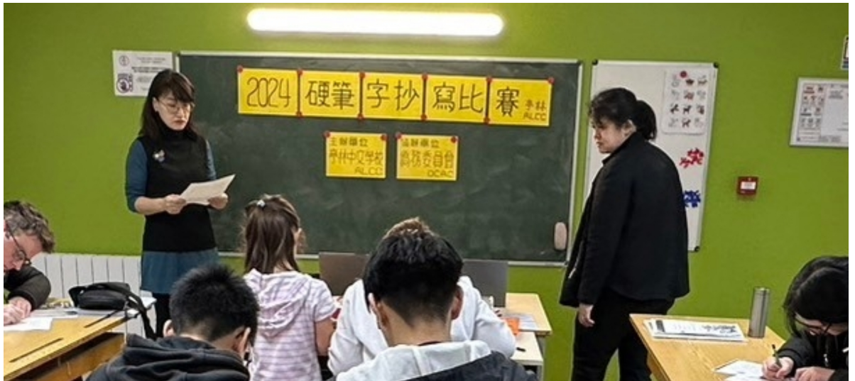
臺灣華語文學習中心-法國亭林中文學校舉辦「2024正體漢字文化節-硬筆字書寫比賽」1

透過以舉辦硬筆字書寫比賽的方式，讓學生更專注於字型的工整，同時培養學生的寫字能力和良好的認字習慣，深受參賽者與家長的好評與肯定。