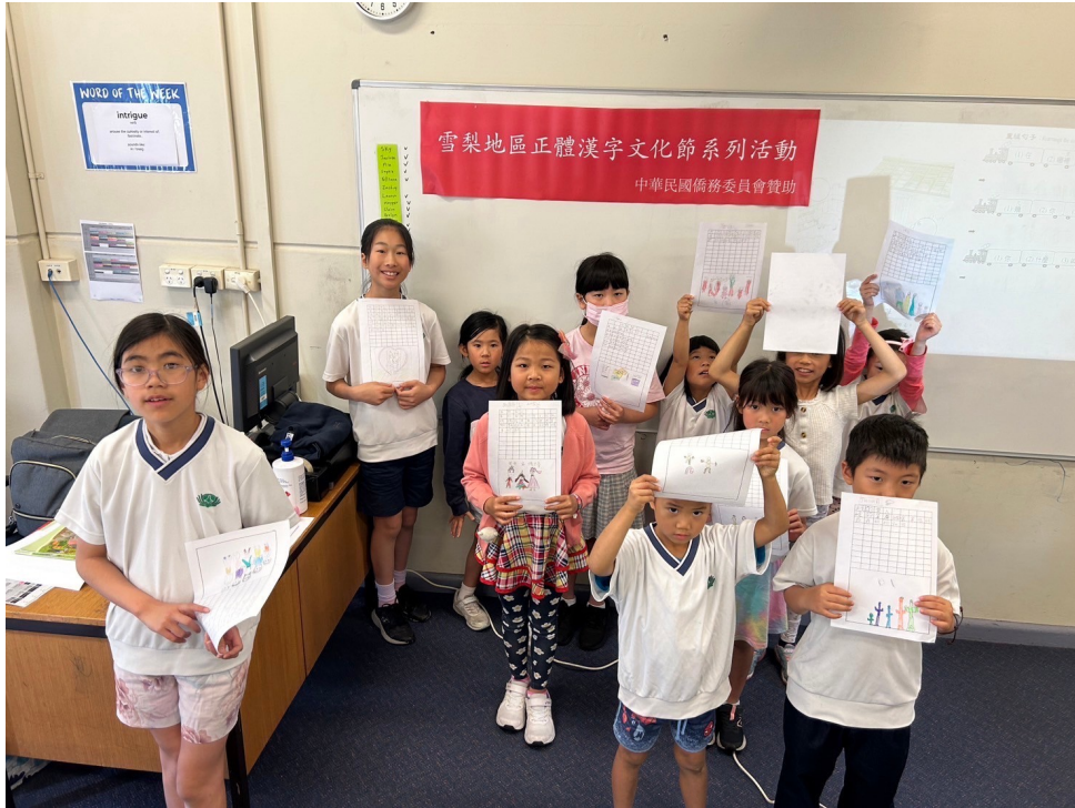
澳洲慈濟人文學校舉辦 2024漢字文化節作文比賽4