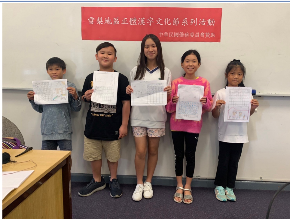
澳洲慈濟人文學校舉辦 2024漢字文化節作文比賽2