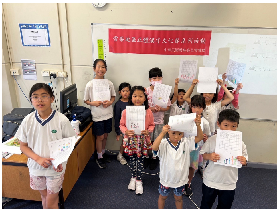
澳洲慈濟人文學校舉辦 2024漢字文化節作文比賽4