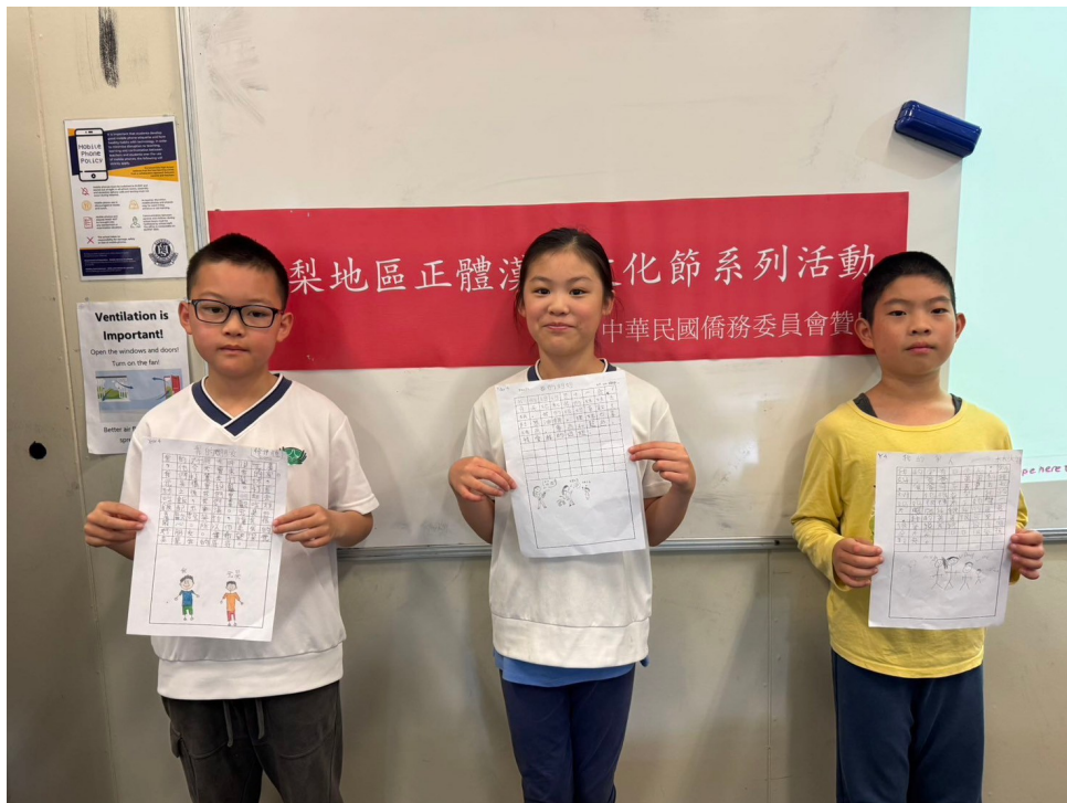
澳洲慈濟人文學校舉辦 2024漢字文化節作文比賽1

比賽分為低年級、中年級和高年級組別，根據不同年齡層進行評比。所有參賽學生都能獲得鼓勵獎，而表現優異的學生則會獲頒獎狀和獎品，以示嘉獎。學校期望通過多元的活動，幫助孩子們學以致用，在海外也能保持對中文學習的熱情，並成為中華文化的傳承者。