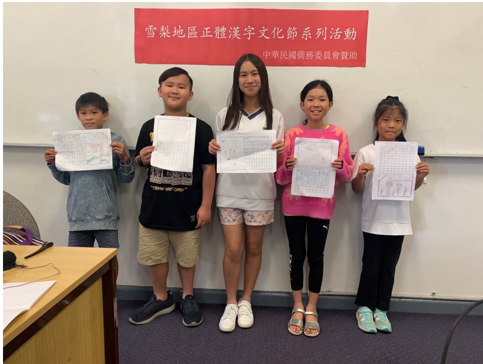
澳洲慈濟人文學校舉辦 2024漢字文化節作文比賽2