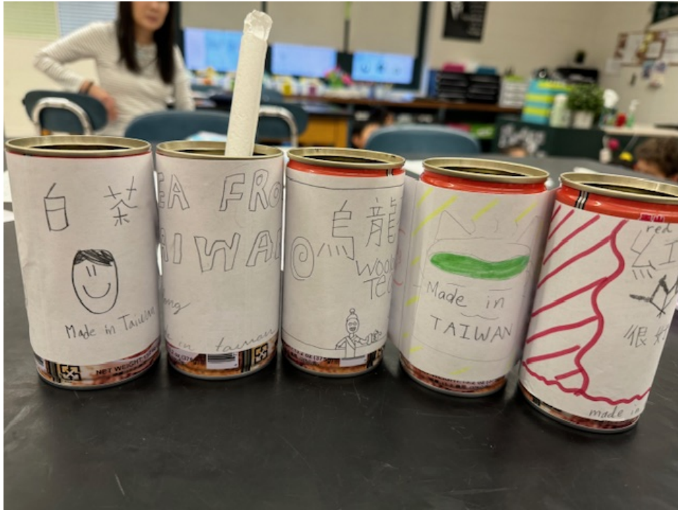
同學們設計的茶罐外包裝