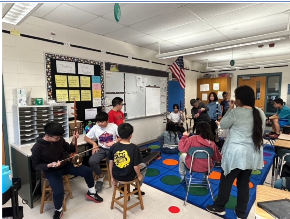
同學們親自體驗拉胡琴的感覺。