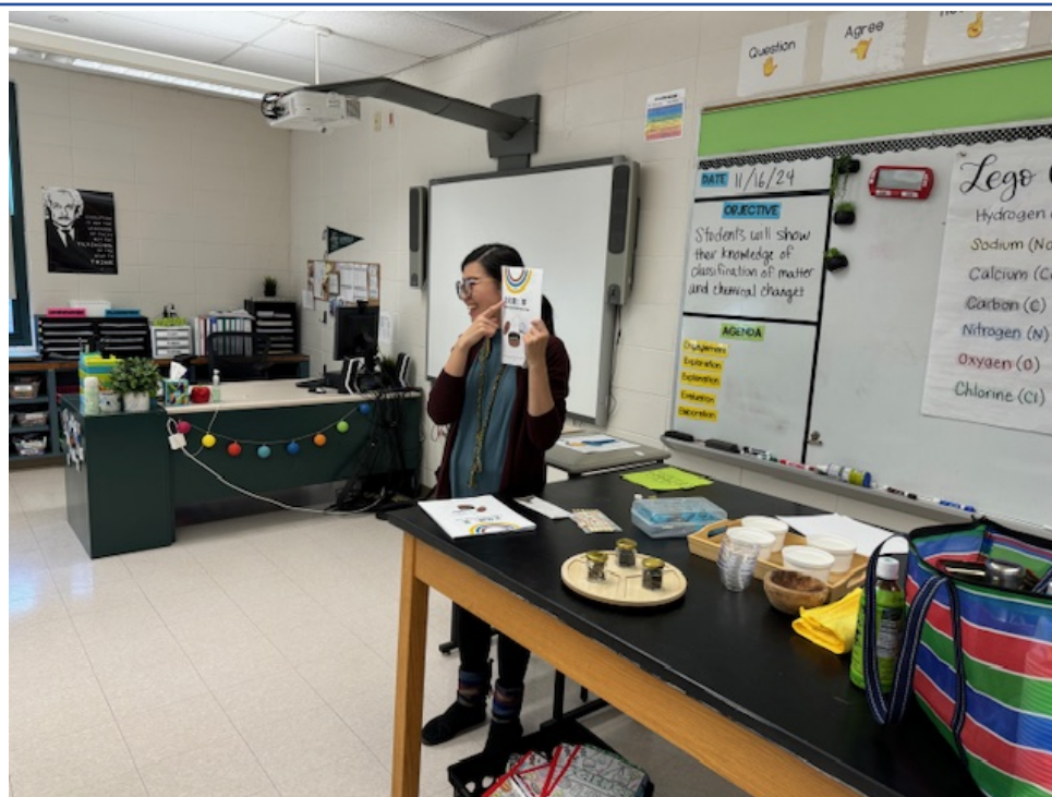
銀魚老師帶來了三種茶葉讓同學們觀察其外型和香味的不同