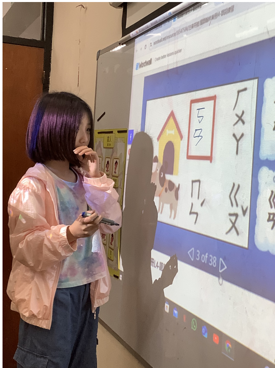
新興文教中文學校2024學前組雙拼比賽1

本校在十月底舉辦了低年級看圖說故事比賽完後，乘勝追擊在十一月初就舉行了學前組雙拼比賽，雙拼就是注音符號中的聲母加上韻母所結合成的音，漢字除了有雙拼的字音，還有三拼的字音，而三拼的字音必須建立在雙拼上，否則便會不知所從，故在學前班的時，在學習注音符號時，何謂聲母？何謂韻母？就是學習的重點和目標。有人說注音符號難學，但卻是學習中文的必經路程，試看中文字的字形，它和注音符號卻是有關聯的，包子的〔包〕就帶有勺的符號，〔巫〕字除了有乚的符號外，還帶有又的符號，故能將注音符號學好，就是向漢字邁前一大步的基礎。漢字有單音字，也有雙拼和三拼，進入認漢字前，拼音就是教導孩童入門的最前哨。學習的難易就是將拼音過程有趣化，讓學生在適當的教導下，個個育教於樂，不畏學習將拼音如玩遊戲一般，而打下美好的基礎。