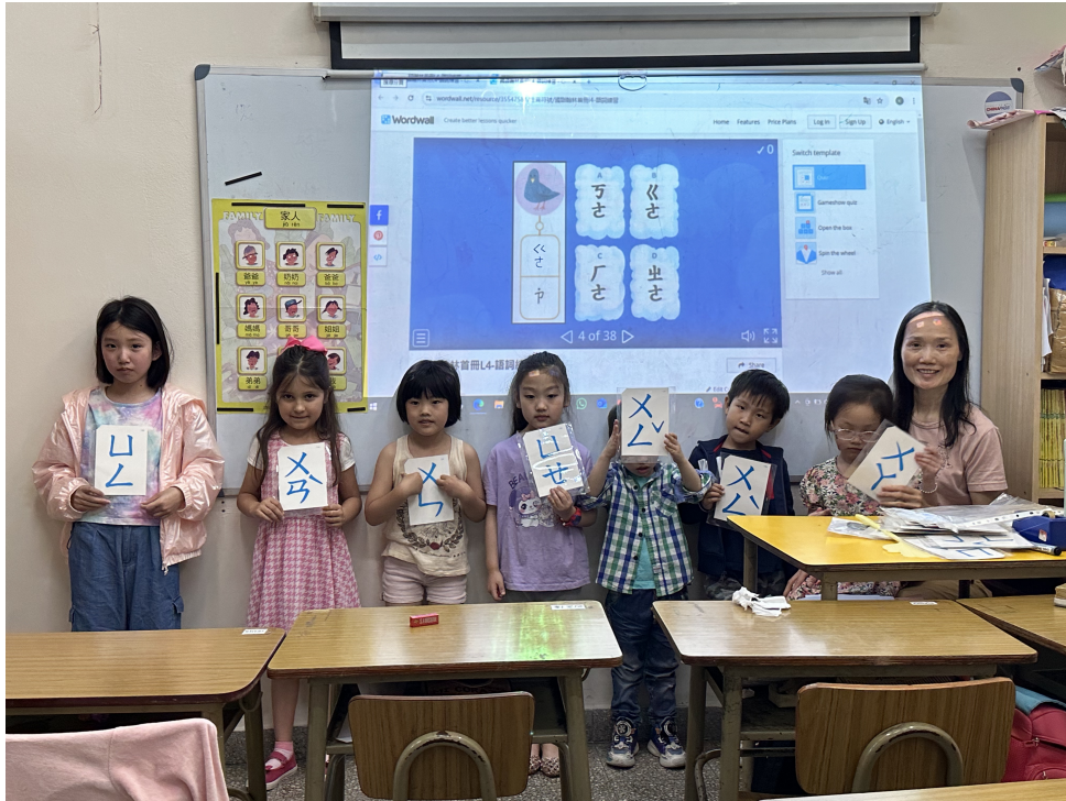
新興文教中文學校2024學前組雙拼比賽3