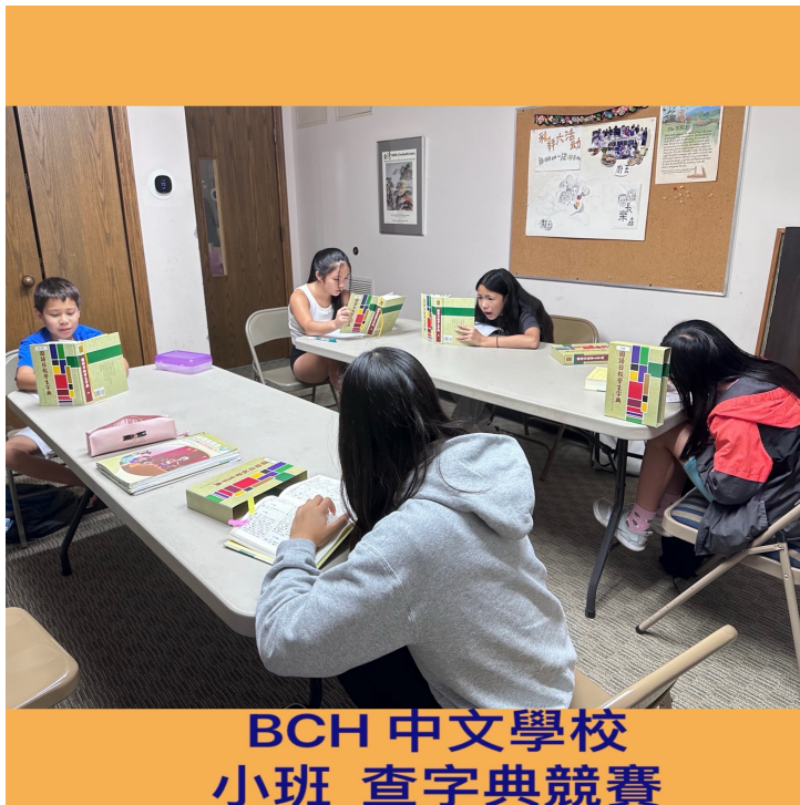
喜樂中文學校2024第三季正體漢字識讀競賽1

老師們為了提高讓孩子們學習中文的興趣，藉用各種競賽方式加上獎品和禮卷禮物做為獎勵方式來提高孩子們學習中文的興趣，效果非常好。