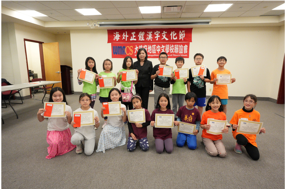
恭喜得獎的小學組同學