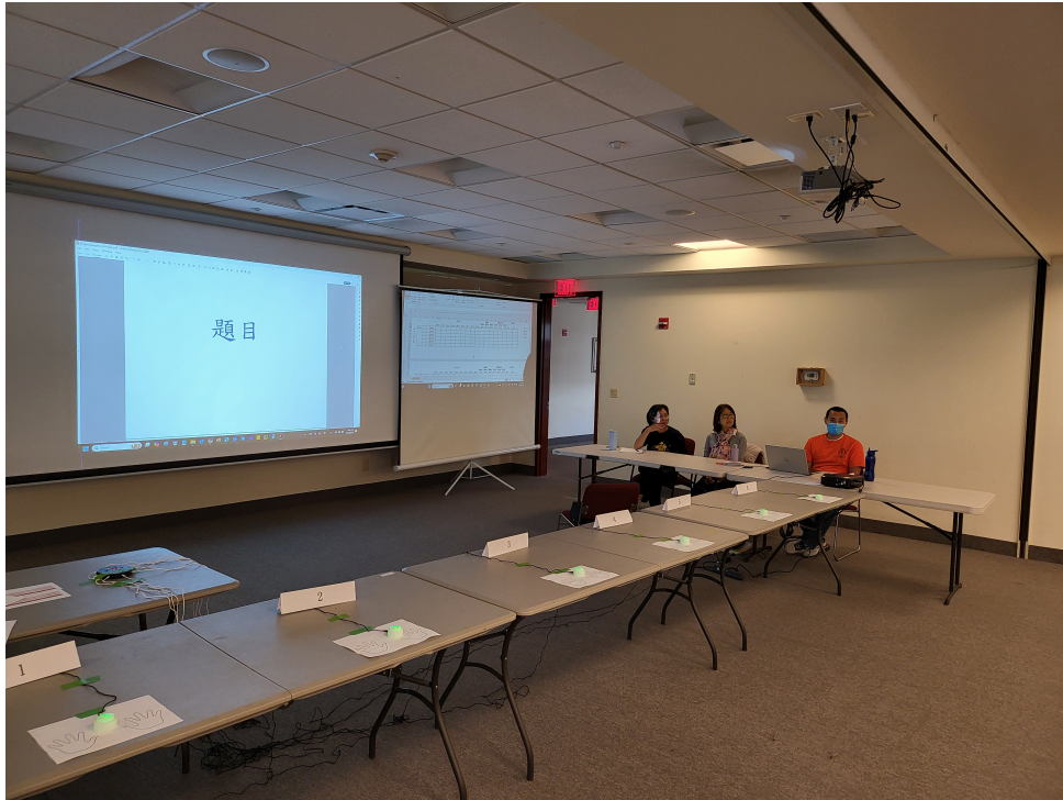
準備就緒的比賽區