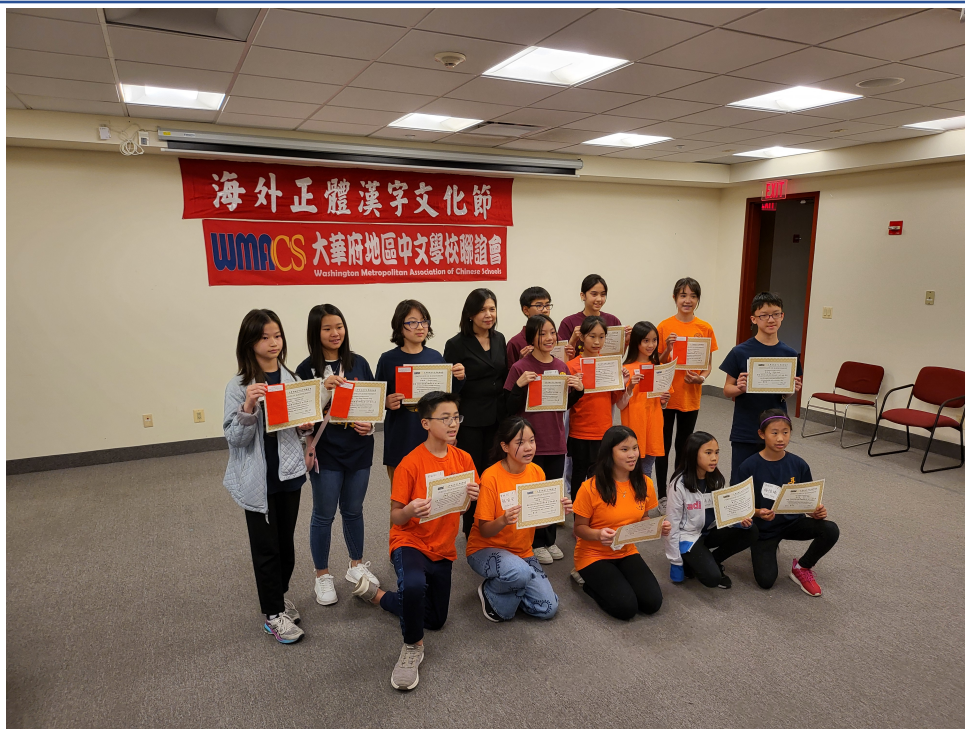
恭喜得獎的中學組同學