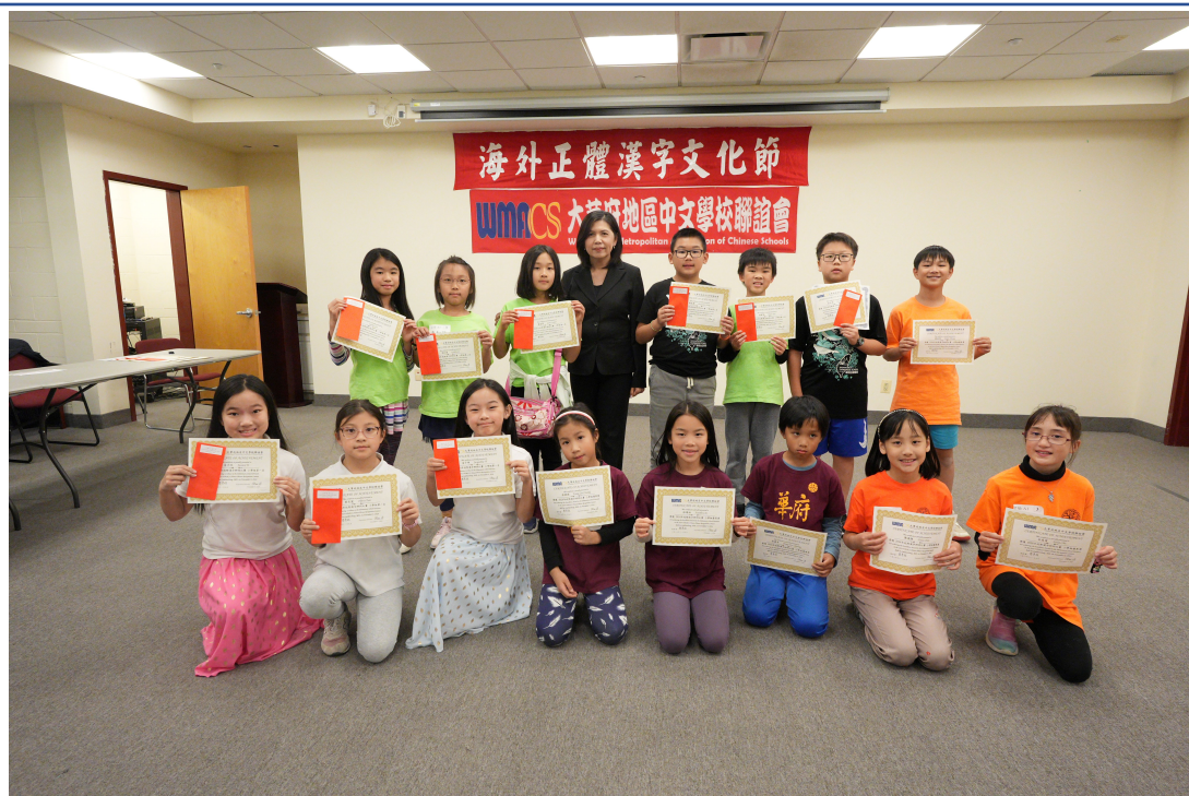
恭喜得獎的小學組同學