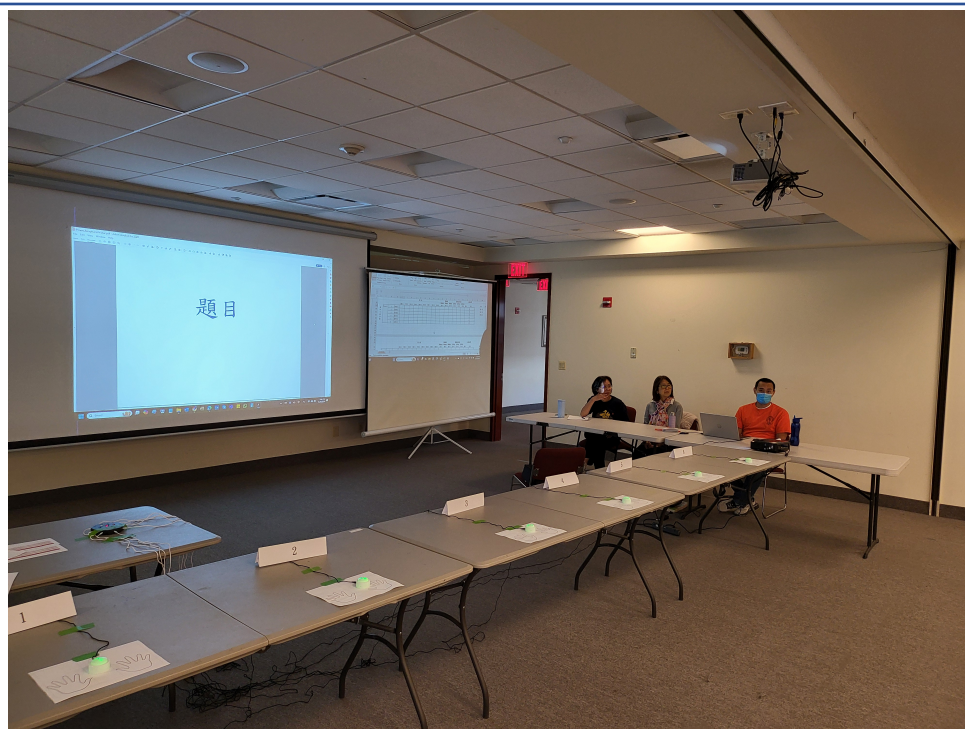
準備就緒的比賽區