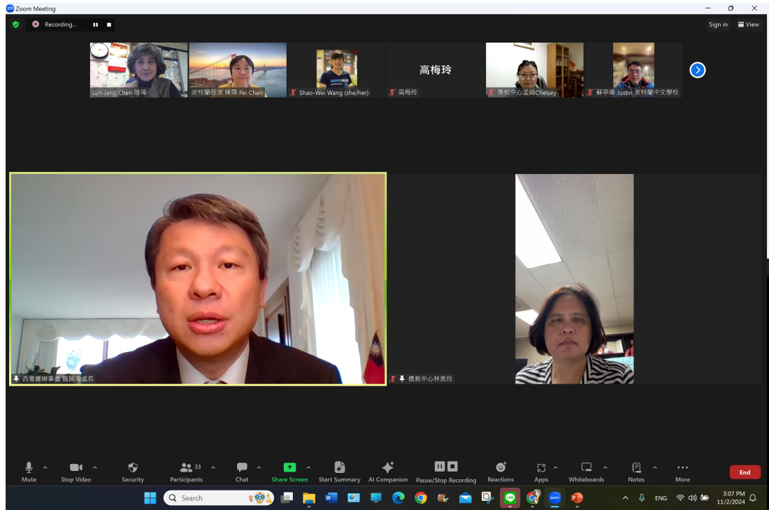
駐西雅圖台北經濟文化辦事處處長 甄國清 致詞