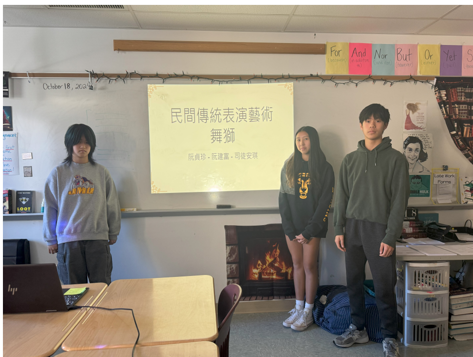
民間傳統表演藝術舞獅