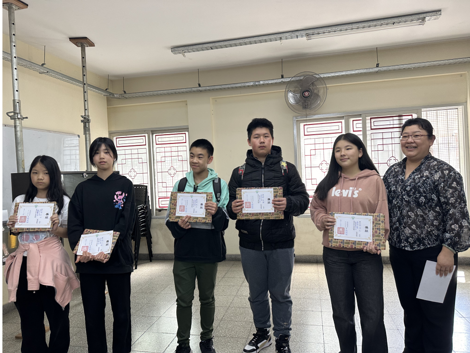
新興文教中文學校2024年中高年級查字典比賽2