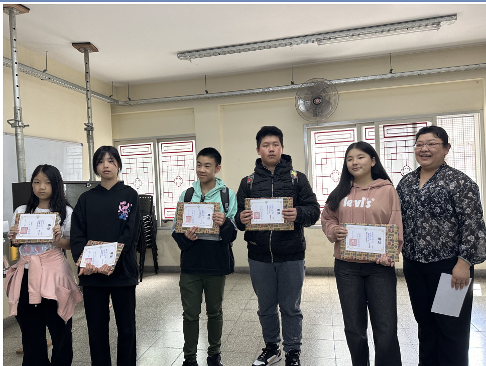
新興文教中文學校2024年中高年級查字典比賽2