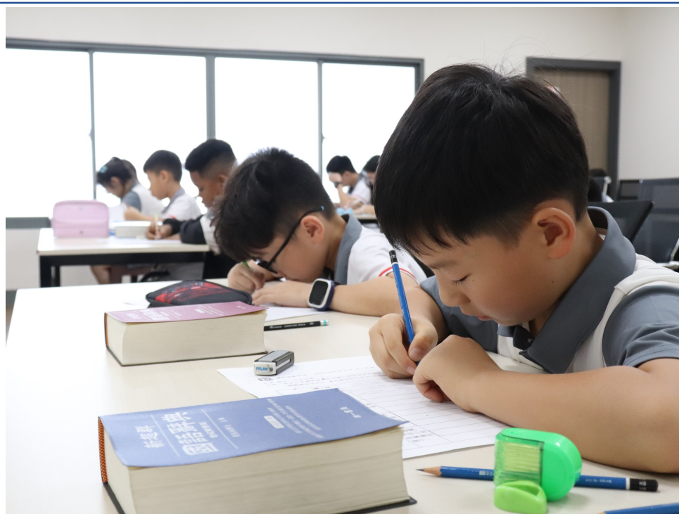
孩子專心的將文字完成。