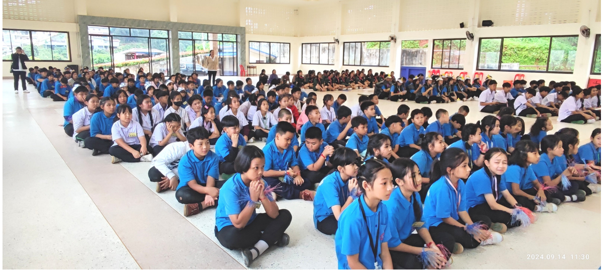
於禮堂準備班歌班呼比賽