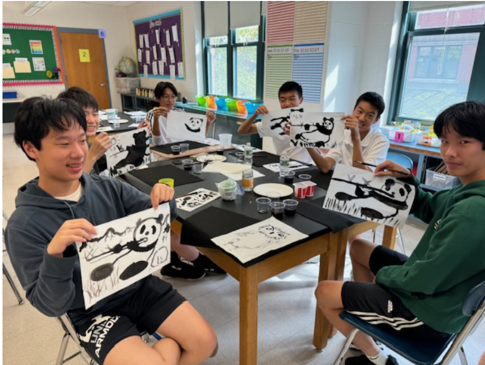
九年級的男同學展示自己所畫的貓熊作品