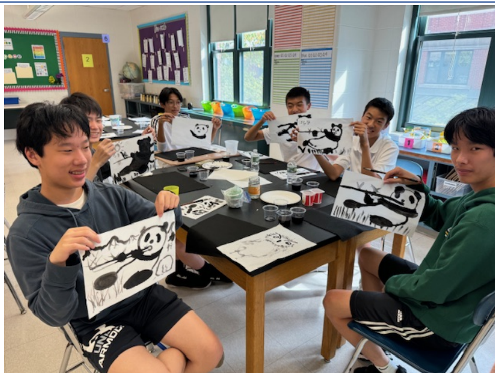
九年級的男同學展示自己所畫的貓熊作品