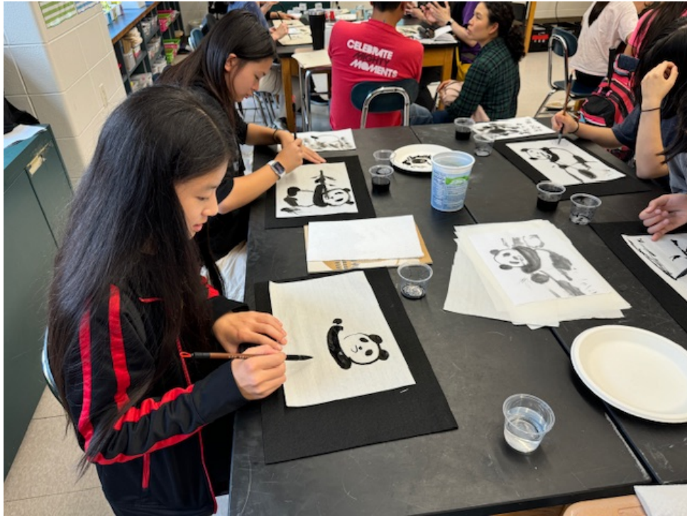
八年級同學聚精會神的畫畫。