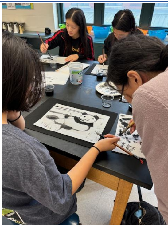
蔡老師指導學生運用毛筆畫出眼睛。