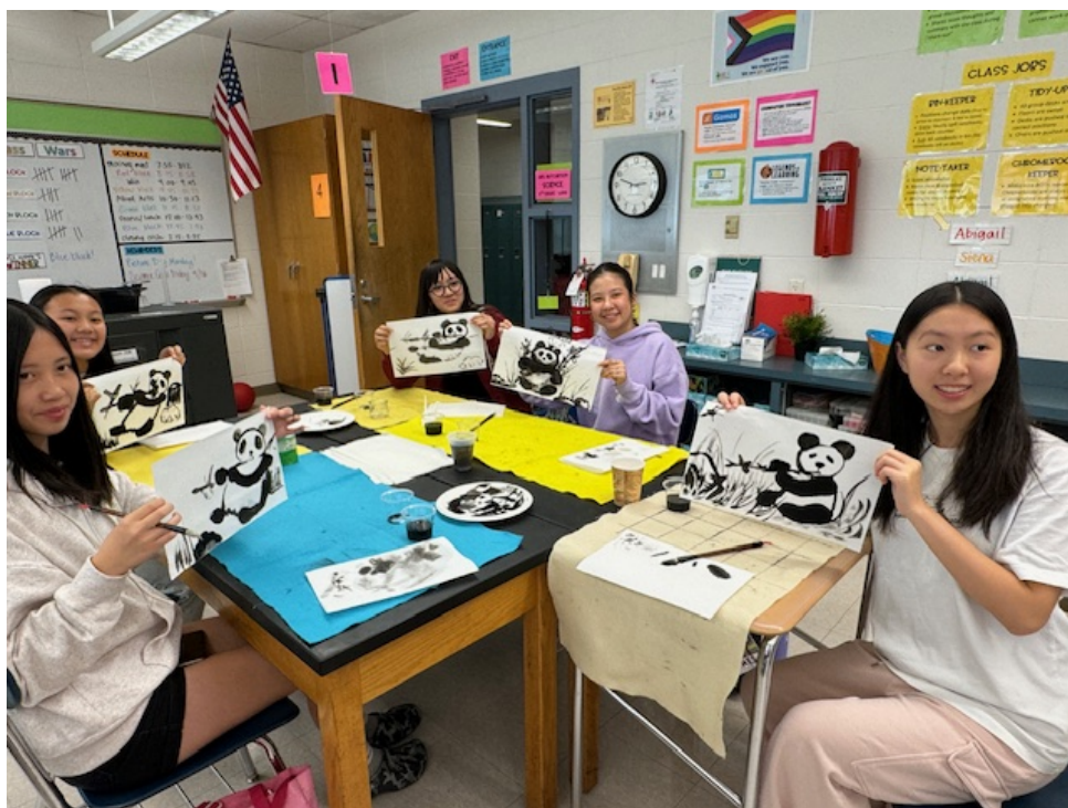
九年級的女同學展示自己所畫的貓熊作品。

今年勒星頓在文化課系列課程的安排，除了介紹各主題文化的歷史來由，和藝術欣賞等，手作部分是學校設計文化課的最主要的重點。這次的國畫課同學們透過練習毛筆，墨水，水彩等工具親身體驗畫國畫不同於一般西畫的方式，希望這堂文化課，讓學生們透過國畫能夠體會到中華文化的深厚底蘊，從而促進文化的傳承和發揚。