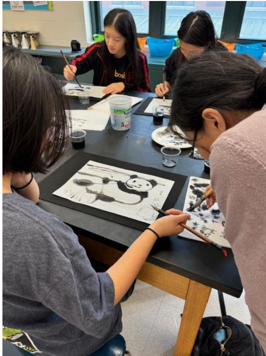
蔡老師指導學生運用毛筆畫出眼睛。