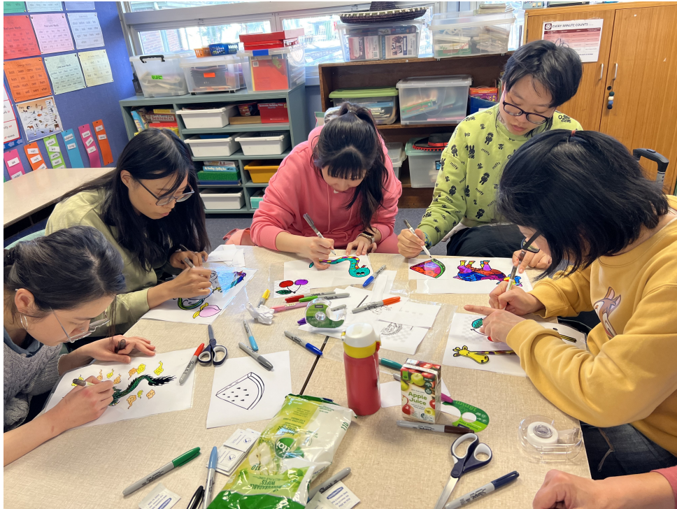
老師發揮創意，把動物的色彩畫得五彩繽紛