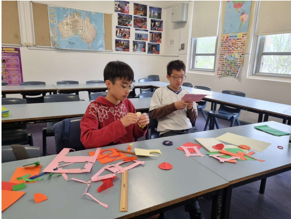
雪梨慈濟人文學校老師 舉辦2024中秋節活動5