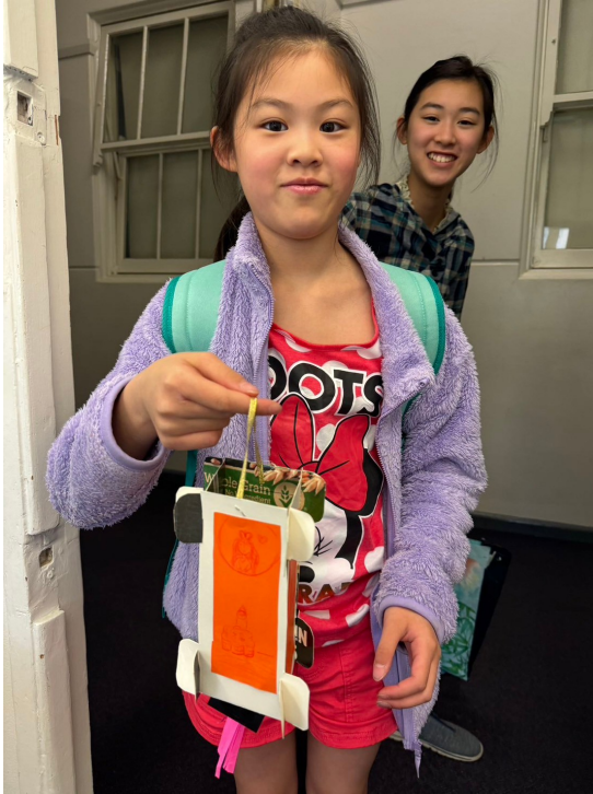
雪梨慈濟人文學校老師 舉辦2024中秋節活動2