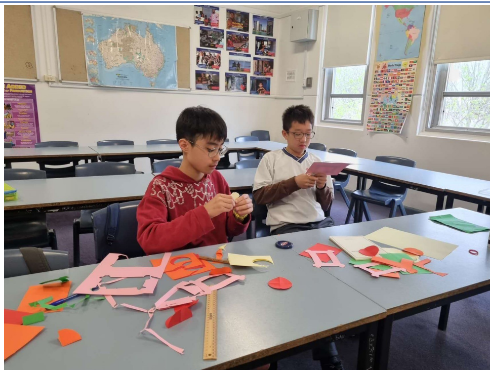
雪梨慈濟人文學校老師 舉辦2024中秋節活動5