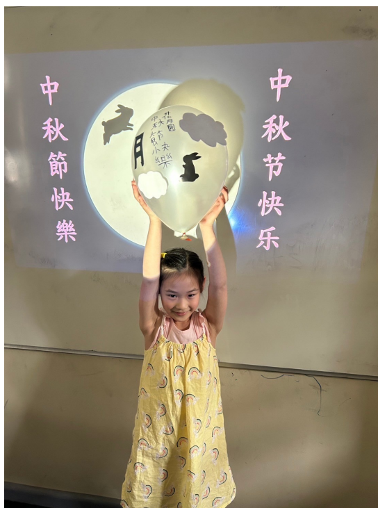
雪梨慈濟人文學校老師 舉辦2024中秋節活動1

在認識中秋節的應節食物和燈籠，老師也提到月餅的種類，月餅雖然美味，但是不能多吃，吃多了會影響健康。老師們用心設計了中秋節系列的闖關活動，結合中秋節教學成果驗收，孩子們都玩得不亦樂乎！