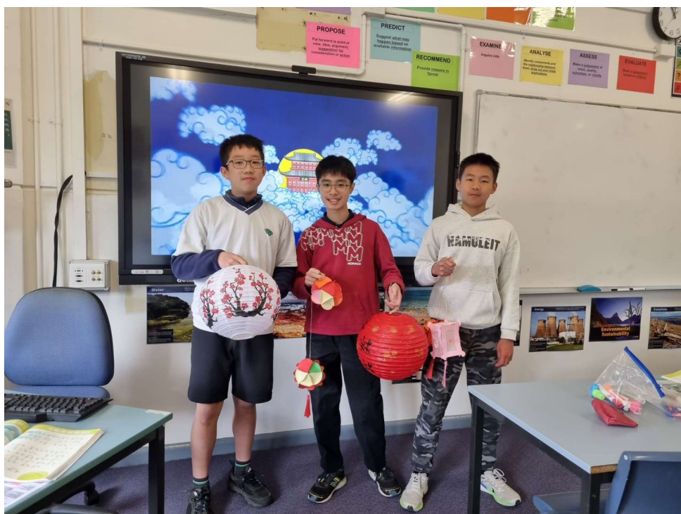
雪梨慈濟人文學校老師 舉辦2024中秋節活動6