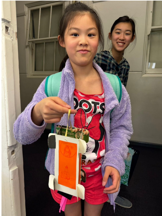
雪梨慈濟人文學校老師 舉辦2024中秋節活動2