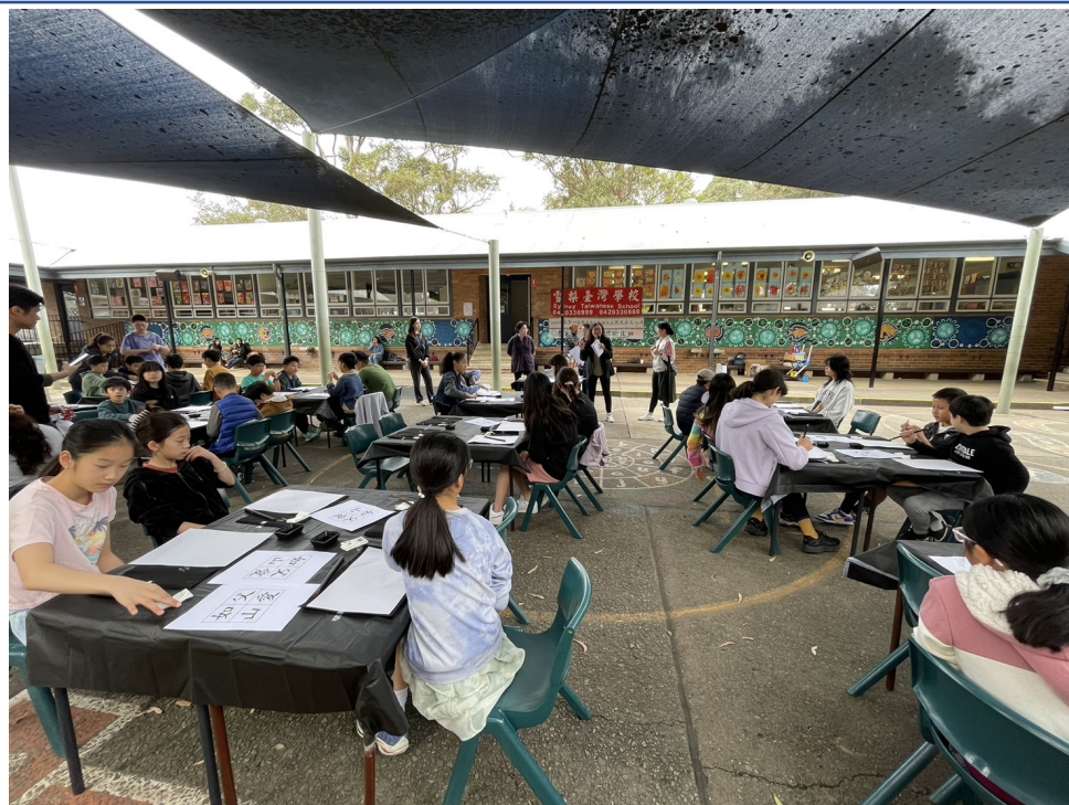
雪梨台灣學校北岸校區(Hornsby) 書法揮毫活動