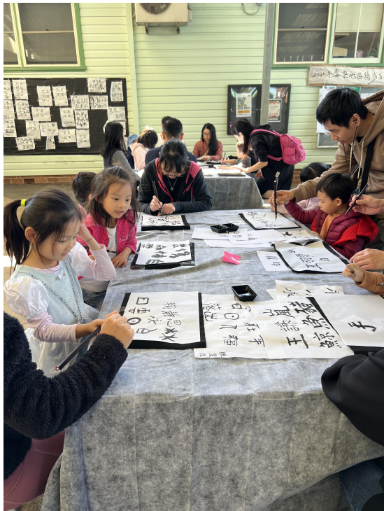
雪梨台灣學校西北校區(James Ruse) 書法揮毫活動